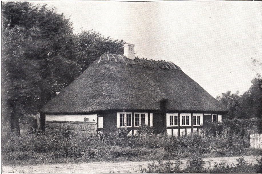
HØJBY FØRSTE FRISKOLE 1862--69