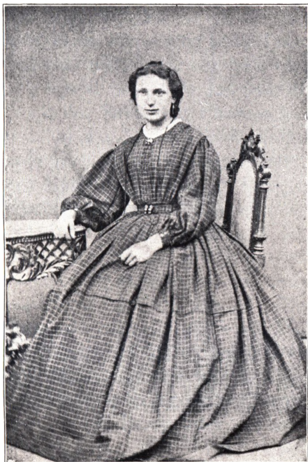
MIN HSTRU 1869. 22 AAR.