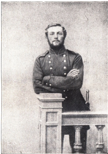
MENIG Nr. 1 VED 5. BATAILLON. 1866.