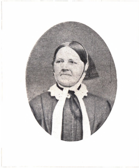
MIN MOR 1870. 61 AAR.