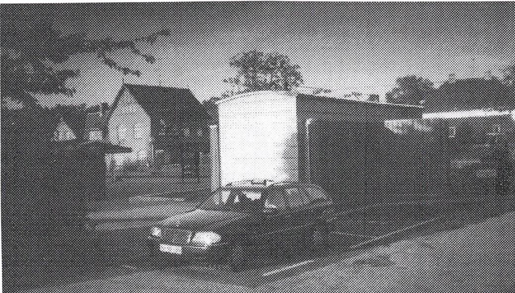
Den nye stationsbygning - med den gamle bygning i baggrunden.

Vurderingen af den nye station er meget forskellig, og når Historisk For-