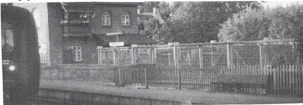
Espergærde Stations nye "cykel-bure". Lever de op til indholdet i DSB's brev ?