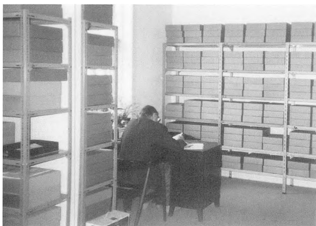
Lokal historisk Arkiv, Jernebanegade 1, læsestue.