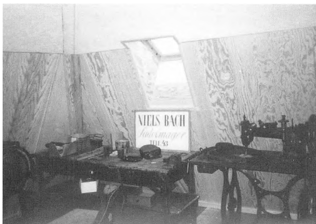
Sadelmagerværkstedet, Lokalarkivet, Jernbanegade 1.

Pladsen i Vestergade var ved at blive trang og da kommunen byggede nyt plejehjem, overtog arkivet førstestuen i det gamle plejehjem på Vandmøllevej, medens postvæsenet lejede stueetagen.