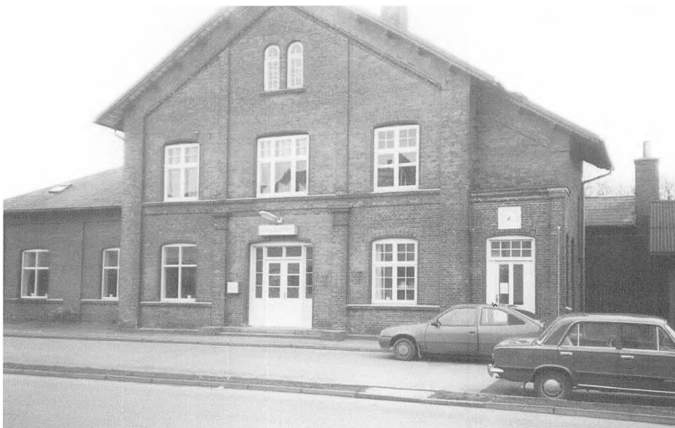
Arkivet Jernbanegade 1. Den gamle stationsbygning.