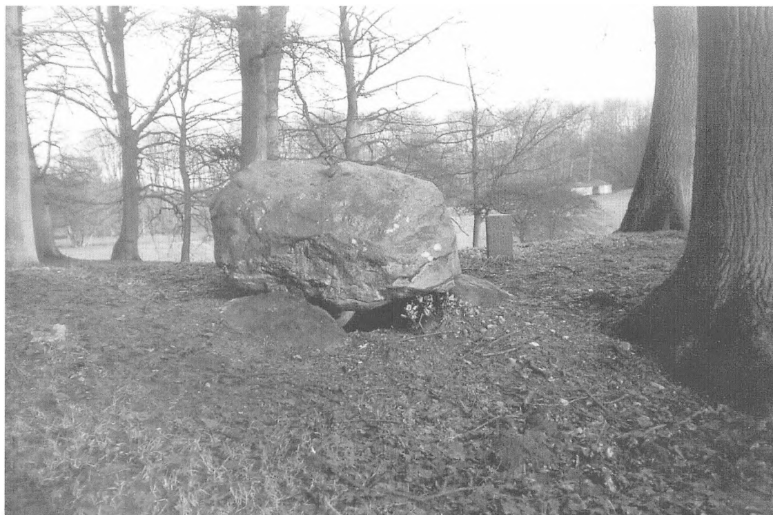
Stenen ved Belle

Det er en spændende sten der ligger på langdyssen overfor engen ved Ørum å.