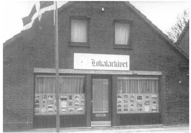
Arkivet i Sygekassens lokaler, Vestergade.