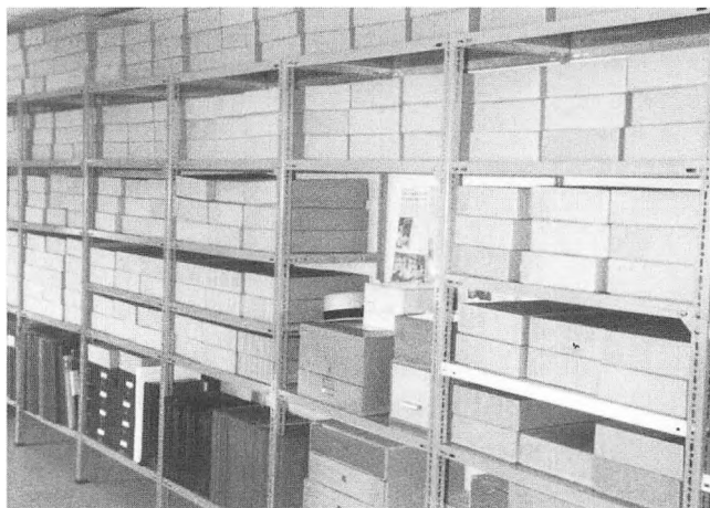
Fra Arkivet på Vandmøllevej.

Nogle kommunalpolitikere har foreslået Gl. Sole skole. Rent pladsmæssigt er det et fantastisk tilbud. Der ville i hvert fald være plads i mange år. Planen duer imidlertid ikke, da skolen ligger for ucentralt. Landssammenslutningen af lokalarkiver »SLA« skriver i en udgivelse »Arkivets takt og tone«, at skal man oprette et nyt arkiv, bør man tage offentlige transportmidlers service i området i betænkning, inden den beslutter sig. En afsides lokalitet, der