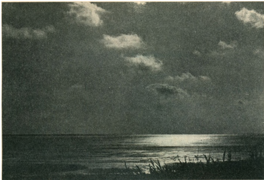
Vadehavet. (Sdj. Maan. Billedkonkurrence 3. Præm.)