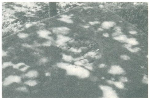
Bordpladen med Bennicksvaabnet.