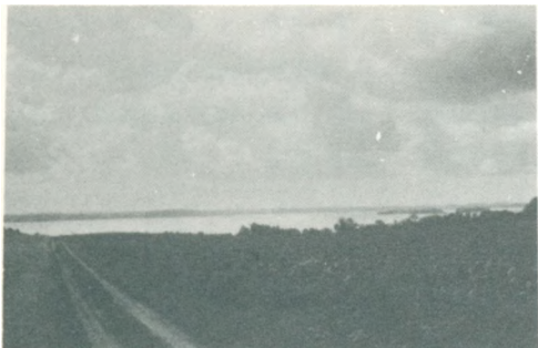
Markvejen ned til Flensborg Fjord.