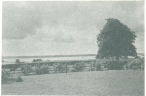
Udsigt fra Bennicksgaard over Flensborg Fjord.