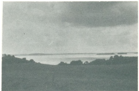
Markvejen Okseørerne ude i Fjorden.