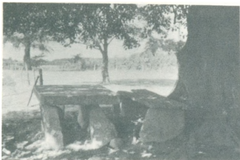
Det gamle Stenbord.