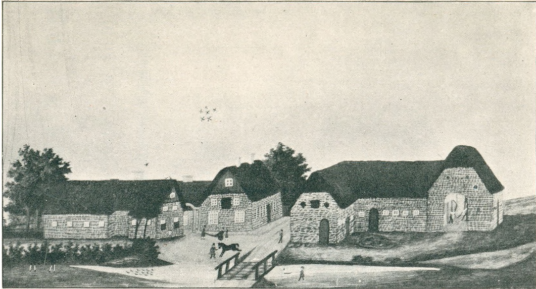
Gelstoft efter Opbygningen 1820.