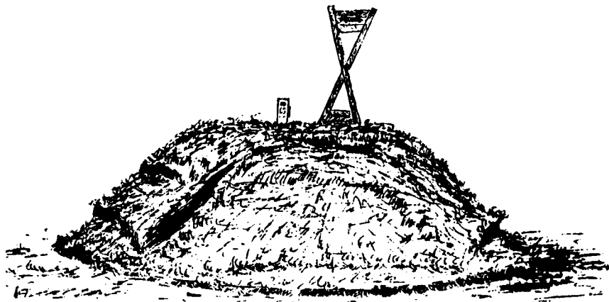
Jelsshøj med skrammer, sten og timeglas

Tidligere havde der på højens top stået et timeglasformet generalstabsmærke. Dette må være blevet fjernet omkring 1873.