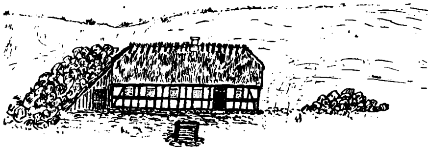
Gården i 1794; 6 fag hus; uden et træ