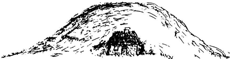
"Kuk-Maren"'s hus 1840

Det første, som faldt, var "Kuk-Maren"'s hus, der var indgravet i Jelshejs sydside. Det havde kun bestået af en kampestensmuret sydside og et halvtag, men havde dog haft skorsten. Ejendommen blev overtaget i 1840, efter at "damen" havde boet der i 16 år. Hun flyttede over til Skåde bakker, og senere til Borum.