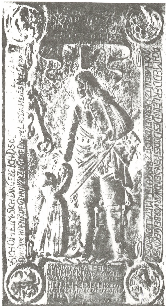
LIGSTEN I DET TERSMEDENSKE KAPEL I SÖDERBÄRKE. Udført c 1653 af Frederik Herman Hoyer (c 1621—1698).