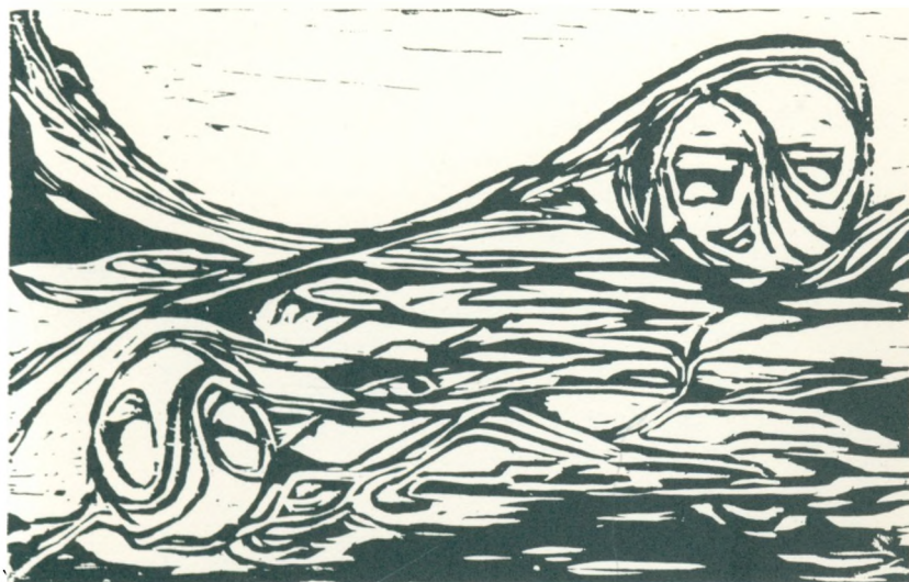
Bølgers kræfter