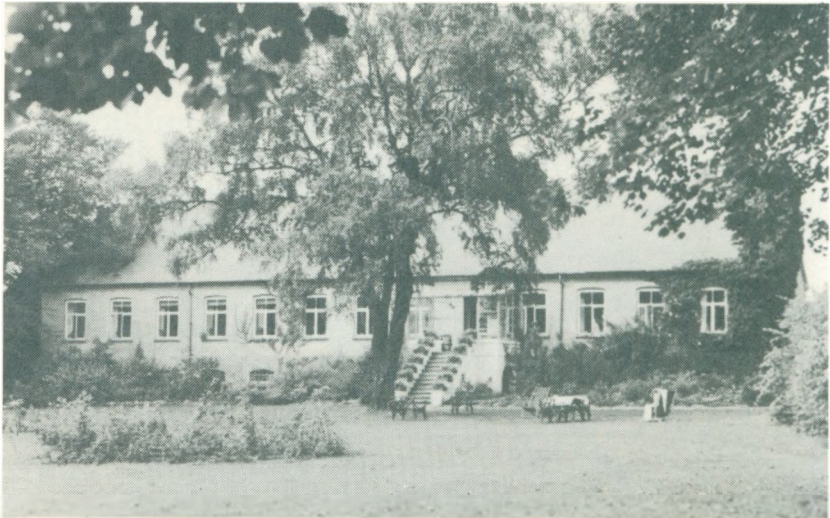
»Ny Vraa« set fra syd.

Mellem alentykke, fritstående træer ses de brede enge – og sommerdage – græssende dyr i flokke eller enkeltvis vandrende ind og ud af synsfeltet.