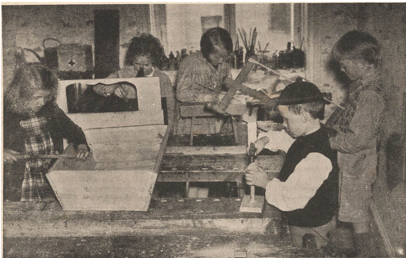
Børnene paa dette Billede har det dejligt — med dyb Interesse gaar de op i en Leg, der er et Arbejde. Ubehaget ved at være under Tvang kender de intet til.