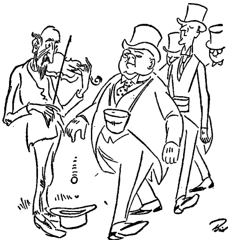
Der var en Stemning, som i de gode gamle Dage.

I Nat drømte jeg mig et lille halvt Aar frem i Tiden, og da jeg vaagnede i den lune Augustmorgen, skyndte jeg mig ud i Entreen efter Bladene, der alle var enige om, at Galopderbyet havde været en stor Oplevelse med kolossal Spillelyst, og man hilste med Tilfredshed, at Publikum paa Saddelplassen var fuldtud saa velklædt som før Krigen, og at de høje graa Hatte, som i mange Aar ikke havde været til at opdrive, nu igen saas i stort Tal. Der var en Stemning som i de gode gamle Dage, jo, selv de lange Rækker af Spillemænd med deres klædelige Lap for Øjet eller helt hyggelige Træben var mødt op igen med deres Kasketter til Ikastning af Fem- og Tiorer. Derbyets kolossale Sukces — med 25.000 betalende Tilskuere — havde bevirket, at Justitsministerens sidste Forslag til Revision af den reviderede, forandrede, ændrede og omarbejdede, renholdte Forræderlov var blevet henvist til Side 11 ved Siden af de indgaaede Skibe til den gamle Havn og Licitationer. Aviserne konstaterede samstemmende, at det var den 10. Revision, medens dog en enkelt, kendt for sin forsigtige Indstilling, mente, det kun var 9. Gang. Det var Hensigten med dette sidste Ændringsforslag at gøre visse begaaede Uretfærdigheder gode igen. Medens man i Vinter havde givet Sommerfolkene den Oprejsning, som disse, der i Virkeligheden næppe havde været andet end skikkelige Natvægttere, havde Krav paa, gik Justitsministerens Forslag denne Gang ud paa at komme de saakaldte Hipo-Mænd til