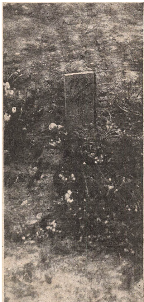
Fra Ryvangen før 5. Maj: Et Nummer paa en Træplade markerer en henrettet Patriots Grav.