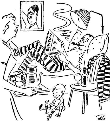
Der maa retfærdigvis tilstræbes en Ordning, saaledes at de paagældende kan ligge hjemme.

Hjælp, for hvem Minimumsstraffen endnu var 1 Aar og kun i formildende Tilfælde af Mord 6 Maaneder. Selvom vore Fængsler maa siges at være humane og Kosten udmærket, maa man retfærdigvis tilstræbe en Ordning, hvorved de paagældende kan spise ude eller ligge hjemme, evt. begge Dele, ligesom der maa gives Forrædderne Anledning til at varetage deres berettigede Interesse gennem deres faglige Organisation »Foreningen af 6. Maj 1945«, hvis Arbejde hæmmes meget, netop ved at en stor Del af Medlemmerne afskæres fra at