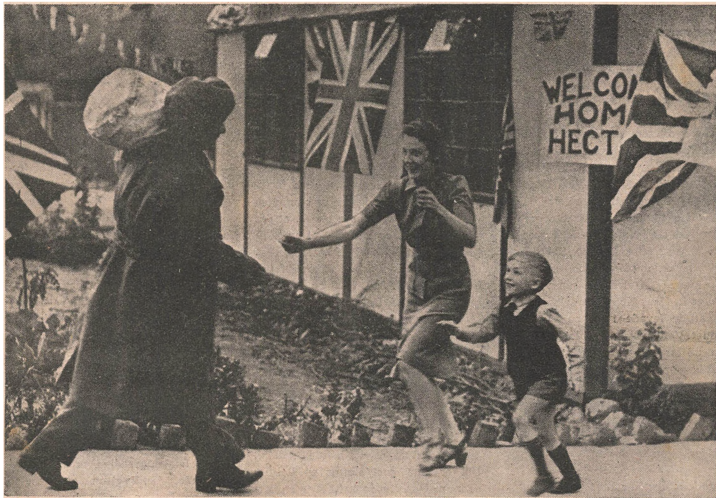
En britisk »Tommy« vender tilbage til sit interimistiske Hjem i det bombhærgede London.