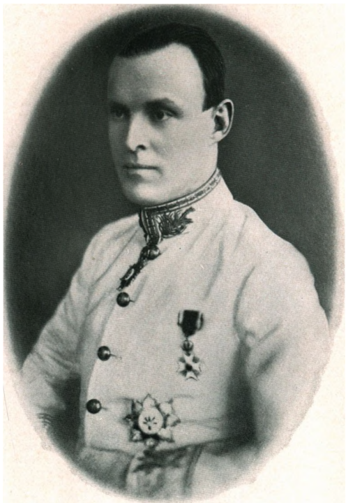
NICOLAI AALL f. 1883 GENERALKONSUL (SIDE 40)