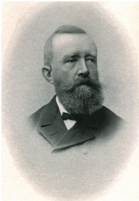
GODSEIER NILS AALL f. 1831 † 1901 EIER AF ULEFOS 1864—1898