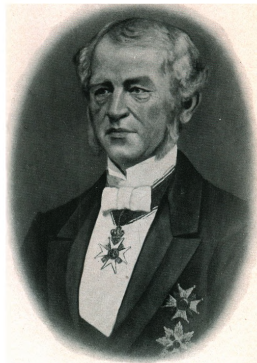
JACOB AALL f. 1809 † 1879 STATSSEKRETÆR, STATSRAAD (EFTER MALERI PAA ULEFOS) (SIDE 27 OG •SLÆGTEN AALL• SIDE 449)