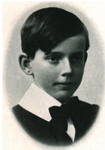
HANS CATO AALL f. 1917