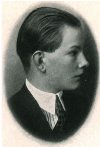
NILS FREDRIK NICOLAI AALL f. 1911