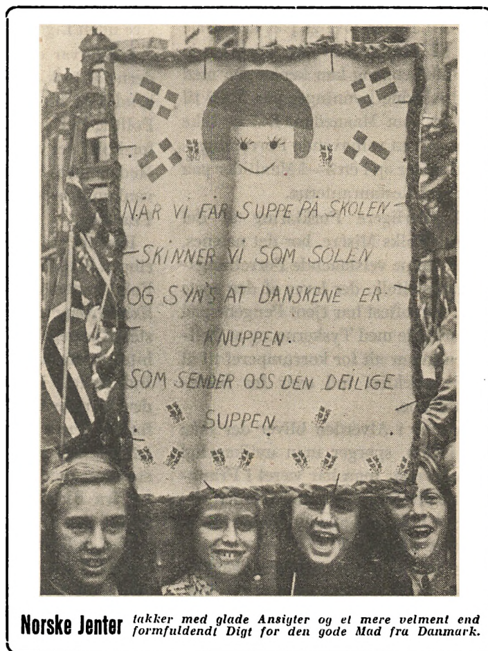
Norske Jenter takker med glade Ansigter og et mere velment end formfuldendt Digt for den gode Mad fra Danmark.