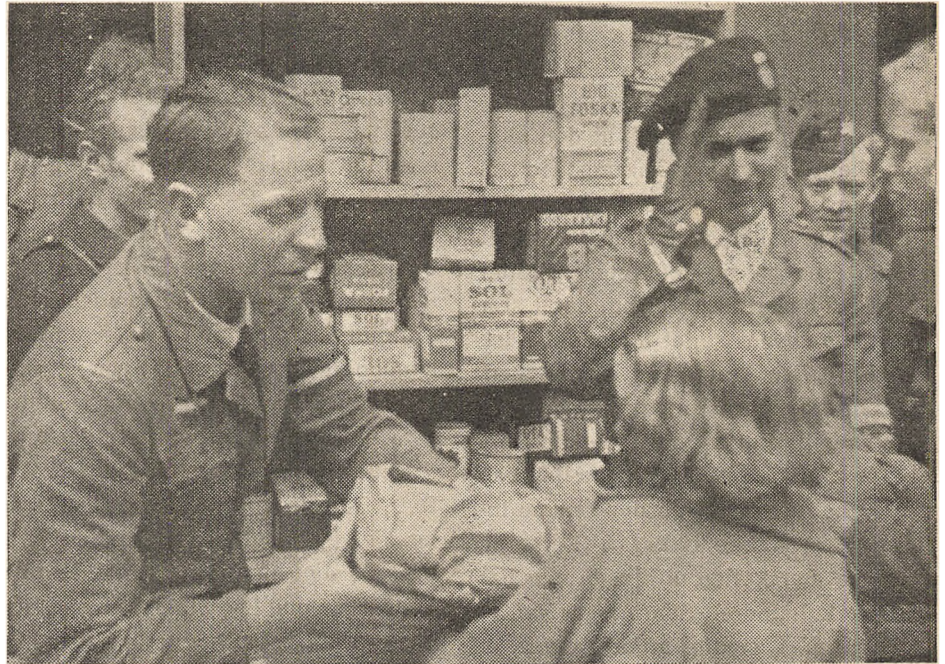
Danske Børn alleverer paa »Norges Dag« Madvarer til de norske Børn.

Enhver Jurist ved, at saadan skal Sagen ikke løses. Det er ikke Benaadning, der søges, men det er Lovgiv-