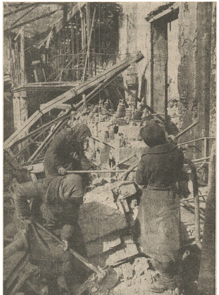
Russiske Kvinder deltager i bogstaveligste Forstand i Sovjetrepublikkens gigantiske Oprydningsarbejde — Forberedelsen til Genopbygningen.