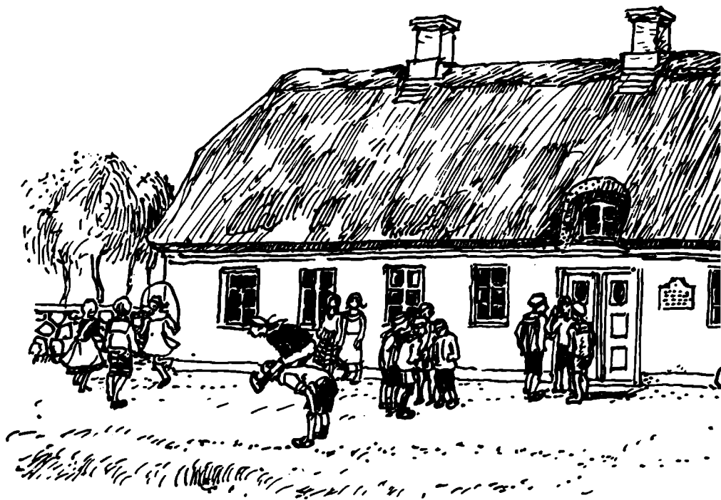
En af de gamle rytterskoler med skolelegeplads. Tegningen er udarbejdet efter et gammelt

så stor, at den måtte sætte af i hop hen ad tagrygningen for at få luft under vingerne. Men havde den det, var den elegant i luften, som et af vore dages jetaeroplaner. Det var overmåde smukt at se.