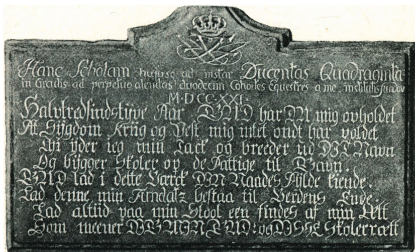
Frederik den 4.'s sandstenstavle, skolens bomærke.

Tavlen med de snørklede, gamle bogstaver og den originale skrivemåde så således ud: