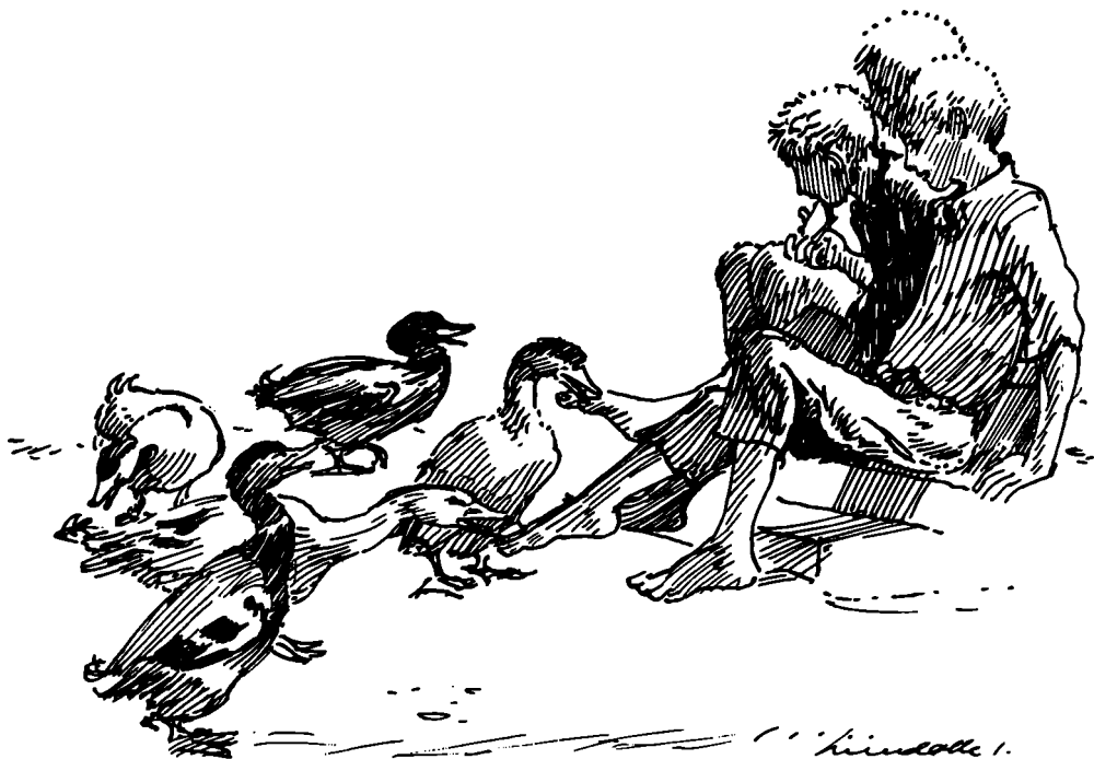
Drengene spiser deres sommereftermiddags-mellemmadder.

På samme tid om eftermiddagen fik jeg og mine to brødre vore eftermiddagsmellemmadder. Vi satte os med dem i hånden på den solvarme trappesten ind til bryggerset og betragtede fjerkræflokken.