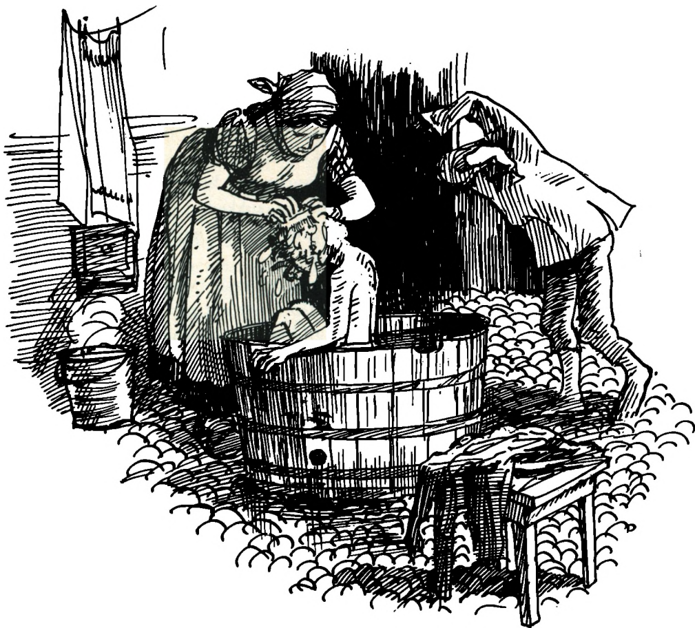
Det ugentlige lørdagsbad i bryggerset.

legepladsen, hvor man tumlede sig sammen på fornøjelig måde i legens fællesskab.