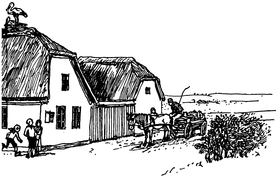
Udspektkort fra århundredskiftet.

Degnen var dog ikke enerådende i gården.