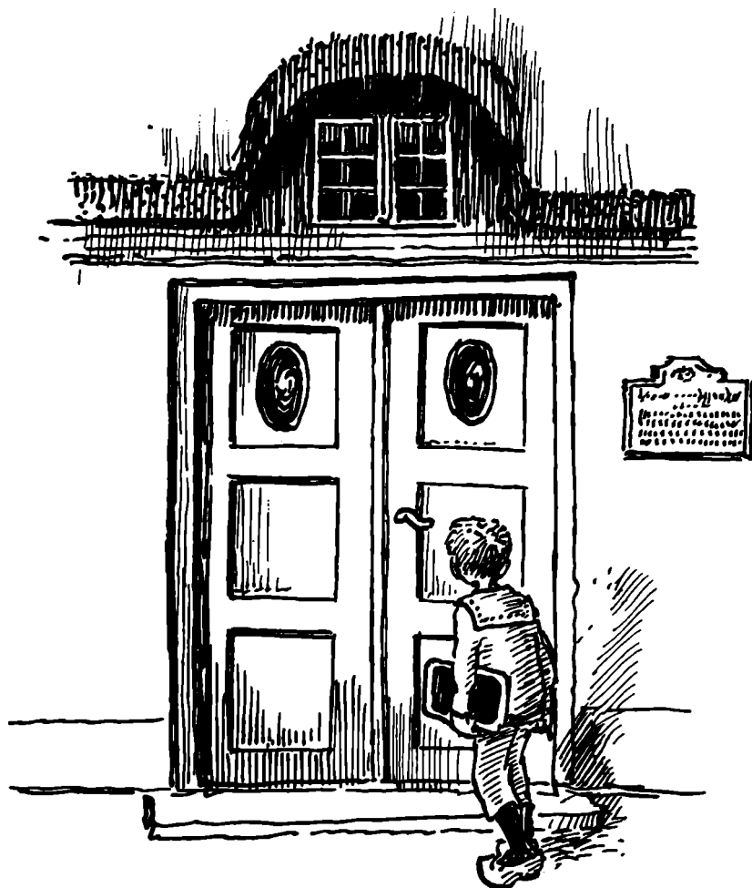
Skolens smukke hoveddør. Et gedigent stykke gammelt håndværkerarbejde.

ingen forældre dengang, der sendte deres børn i skole, uden at de kendte alfabetet og kunne stave. Skolebygningen kendte jeg godt fra gårdsiden med køkkendøren. Degnen havde jeg set mange