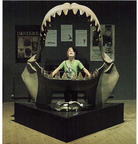
På museet ved Gram Lergrav kan de imponerende fund opleves.

Vi glæder os til at byde jer velkommen. ■