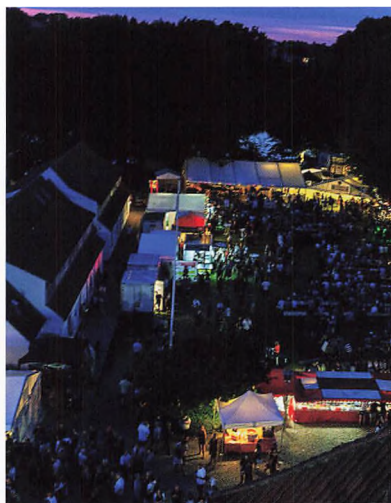
Luftfoto over festivalpladsen.