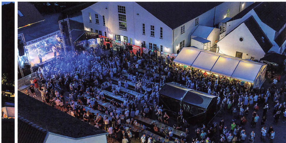
Nord-Als Musikfestival.