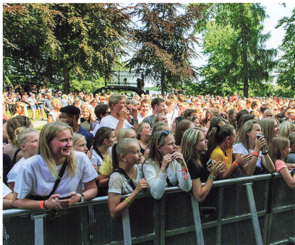
Publikum foran den ene scene til festivalen.