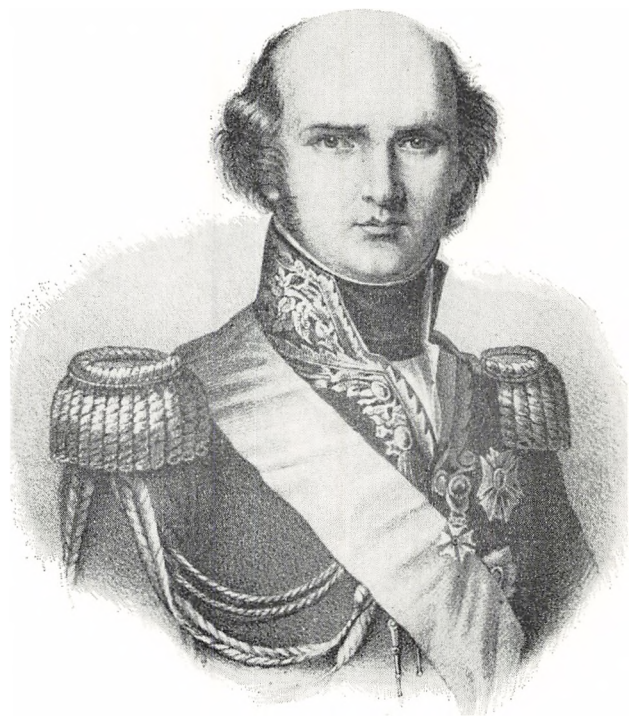
Louis Nicolas Davout, Napoleon I marskal, hertug af Auerstadt, prins af Eckmühl, født den 10. maj 1770 i Annoux, Burgund, død den 1. juni 1823.