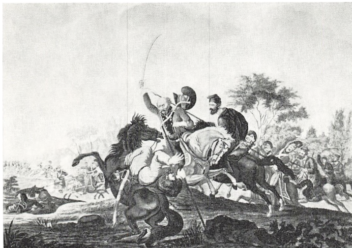
Generalmajor Niels Engelsted, 1759—1816, i slaget ved Rahlstedt den 6. februar 1813. Efter koloreret kobberstik af Jeppe Sonne, på Det nationalhistoriske Museum, Hillerød.