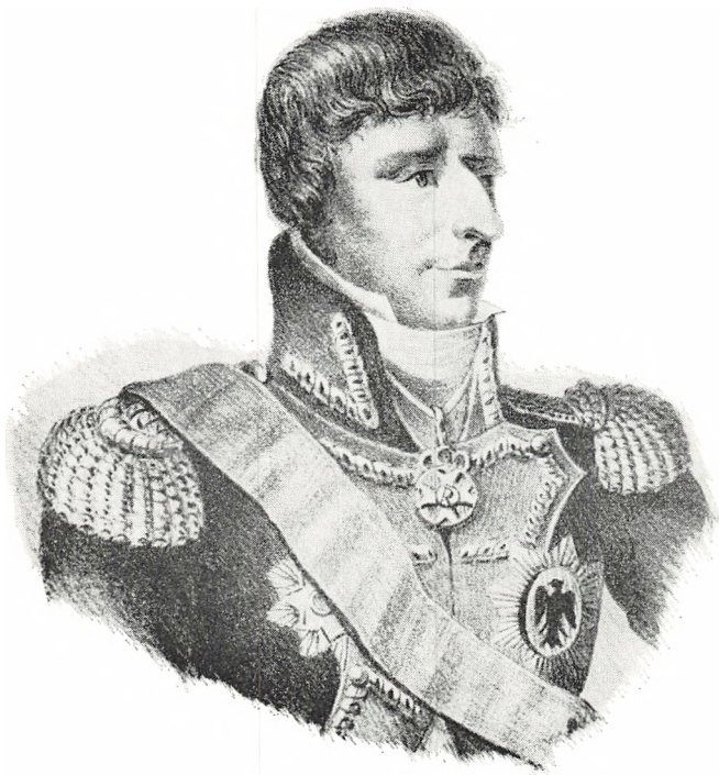
Jean Baptiste Jules Bernadotte, Napoleon I marskal, fyrste af Ponte-Corvo (Neapel), født den 26. januar 1764 i Pau, Bearn, død den 8. marts 1844 som kong Carl XIV Johan af Sverige og Norge.