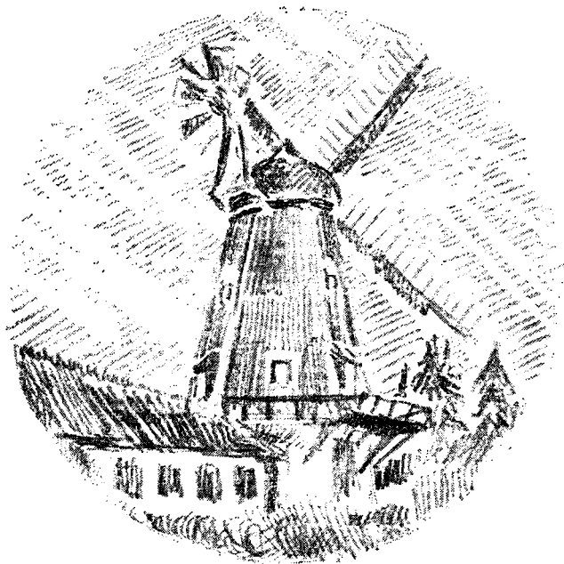
Øverste Ørkilds Mølle ved Svendborg.

Men disse ligesaa praktiske som interessante Stillinger gave mig en saa stor Modbydelighed for det militaire Garnisons Liv i Fredstider, saa jeg i 1815 efter Freden ansøgte og i Naade erholdt min Afsked. Hans Majestæt, Kong Frederik den 6te, bærede mig som Tegn paa sin Tilfredshed med Ridderkorset af Dannebrog og Krigsraad Charakter.