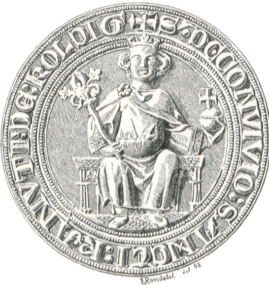
Fig. 13. Kolding (c. 1290).

Se vi nøjere paa de ovenfor nævnte Knudsgilde-Segl, er det givet, at de to sidste ere de yngste. Laholm-Seglet (Fig. 21) er utvivlsomt af en kun daarlig Signetstikker udarbejdet med Landskrone-Seglet (Fig. 20) som Forbillede, og med Hensyn til Landskrone er det ovfr. S. 2 bemærket, at denne By er anlagt efter 1400. Det er i fuld Overensstemmelse hermed, at disse Segls Omskrifter ere i Minuskler og ikke som alle de andre St. Knuds-segl i Majuskler. De lyde: sig[i]llum fraternitatis sancti knuti landskrone in skania (Segl for Hellig Knuds Broderskab i Landskrone i Skaane) og: sigillum co[n]vitiu[m] sancti knuti regis et m[a]r[t]ir[is] i[n] lauholm (Segl for Hellig Knuds, Kongens og Martyrens Gilde i Laholm).