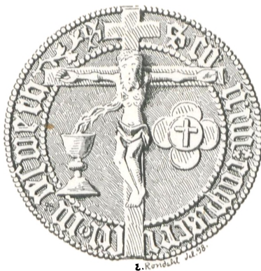
Fig. 59. Helliglegemsgilde i Næstved.