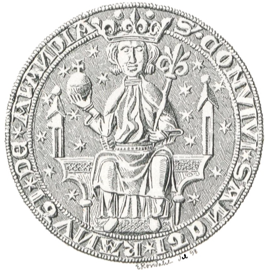
Fig. 14. Alandia (c. 1330).