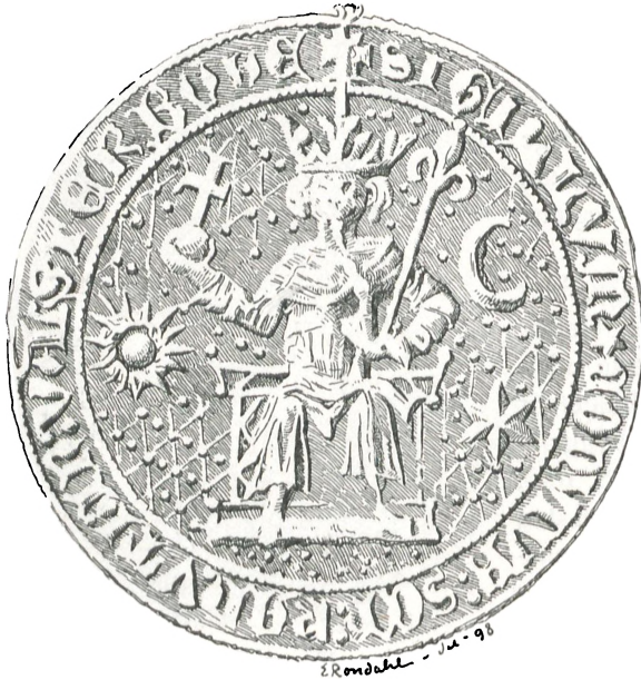
Fig. 18. Falsterbo (c. 1350).

delse, er den Armstilling, hvormed Rigsæblet holdes. Men fra et Forsøg i saa Henseende er der her set bort. Ti den udad og opad böjede Arm, der ses i Fig. 1 og lader Rigsæblet blive baaret med Underarmen i mere eller mindre lodret Stilling, er forladt i Valdemar Sejrs Segl, men bliver optagen igjen i Erik Klippings Segl. Heller ikke Armens Anbringelse hen over Brystet kan betragtes som en paalidelig Tidsmaaler, ti medens Fig. 5 maa betragtes som et væsentlig gammelt Segl, er Fig. 10 og Fig. 17 forholdsvis unge.