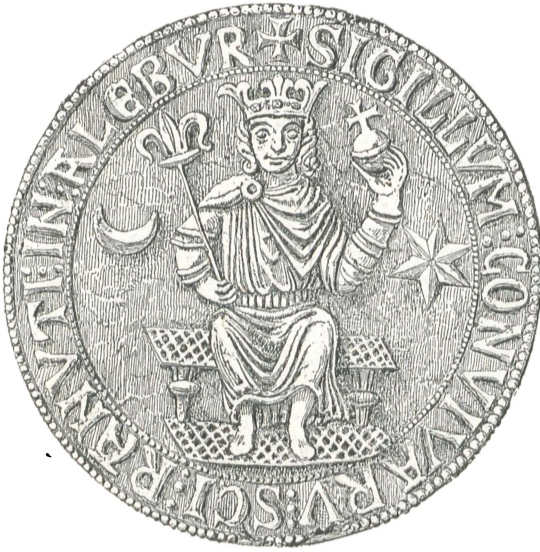
Fig. 11. Aalborg (c. 1275).