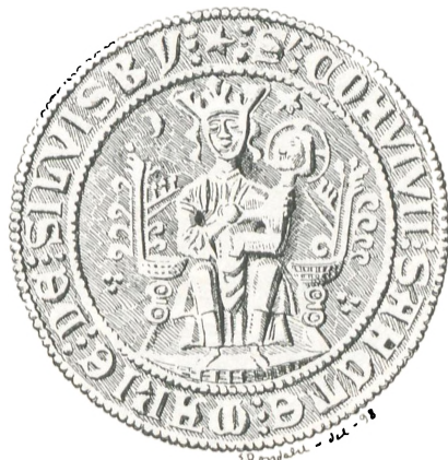
Fig. 43. Mariegilde i Sølvesborg.