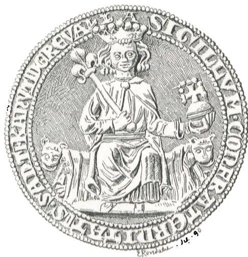
Fig. 32. Reval (c. 1325).

34 har Omskriften: s[IGILLVM] CONVIVII SANCTI KANVTI DE SIGTVNIA (Segl for Hellig Knuds Gilde i Sigtuna), og Fig. 35: s[IGILLVM] CONVIVII SANCTI KANVTI AROSIEN[SI]S (Segl for Hellig Knuds Gilde i Vesterås). Der er Noget ved Tronstolen i Fig. 34, der minder om Erik Menveds Segl, og da den Kirkebygning, Hellig Knud paa det er anbragt i, minder om lignende Bygninger