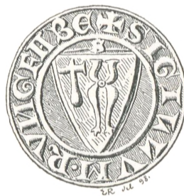
Fig. 58. Rungfabes I