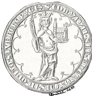
Fig. 40. St. Gertrudsgilde i Stubbekjøbing.

Messer, Bønner o. lign., i anden Henseende Sammenkomster med Spise og Drikke. Vi træffe nu Gilder viede til en Række forskellige Helgener, og navnlig synes St. Gertrud at have været en yndet Helgeninde. 1341 nævnes et Gertrudsgilde i Søborg (?), 1343 et i Odense, 1379 et i Flensborg, 1395 et i Kållundborg, og Seglet Fig. 40 viser, at der c. 1350