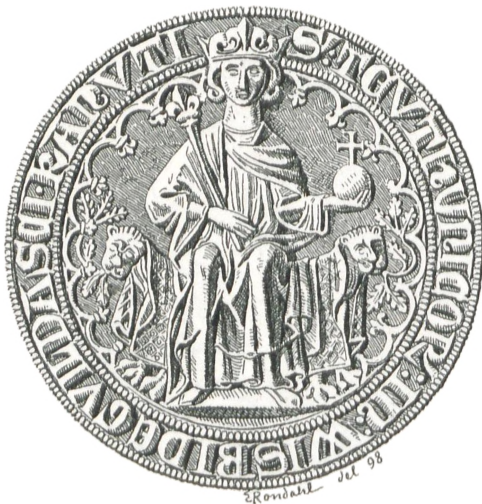
Fig. 31. Visby (c. 1325).