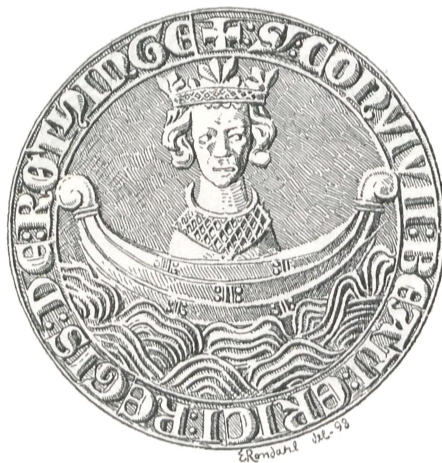
Fig. 8. Eriksgilde i Rødninge paa Møen (c. 1275).

Folkehelgenen i Fig. 7 er fremstillet ved den sædvanlige Kongeskikkelse, fuldstændig som i Knudsgilderne; begge disse Segls Signeter findes i Nationalmuseets anden Afdeling. Hvad der her særlig skal lægges Mærke til, er imidlertid, at Forskjelligt tyder paa, at denne danske Helgen oftere for Bevidstheden er gaaet i Et med den berømte svenske Konge Erik den Hellige († 1160) 5 .