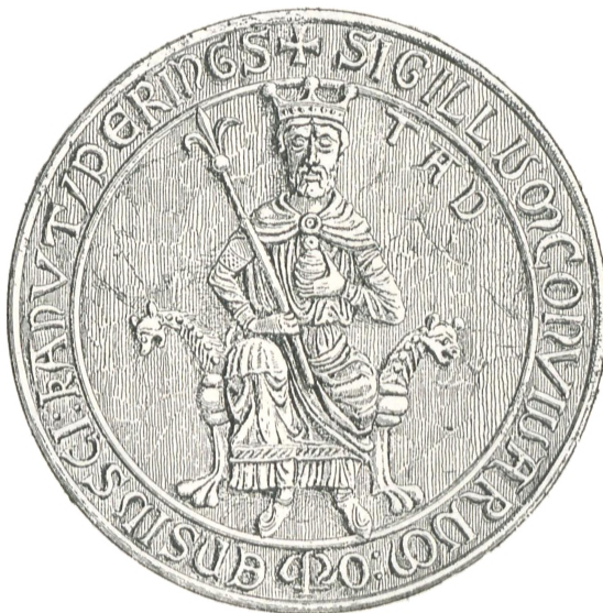
Fig. 5. Odense (c. 1250).