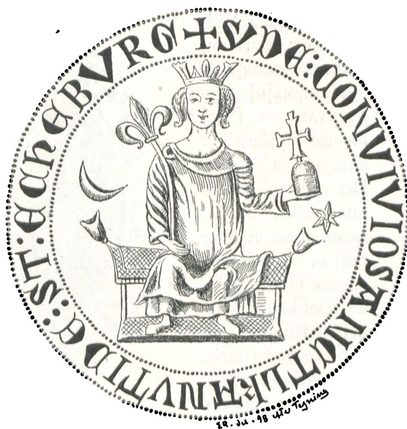
Fig. 27. Stege.

kunde, og er det sidste Ord læst rigtigt, er det Eneste, man kan sige, at vi ikke vide, hvor Serresholm ligger. Det er Arkitekt F. Uldalls forekommende Velvilje, der har gjort det muligt, at Ovenstaaende om de tre Kirkeklokkers Knudssegl ligesom Billedet Fig. 30 her kan meddeles.