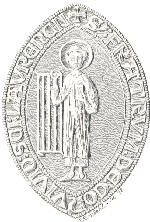
Fig. 55. St. Laurentiusgilde i Visby.

Endnu skal her efter C. G. Brunius (Skånes Konsthistoria, S. 654) meddeles, at der findes endnu et Jakobssegel, fra Trelleborg i Skaane, med Omskriften: »sancte iacobs gildes signete i threleborgh«.