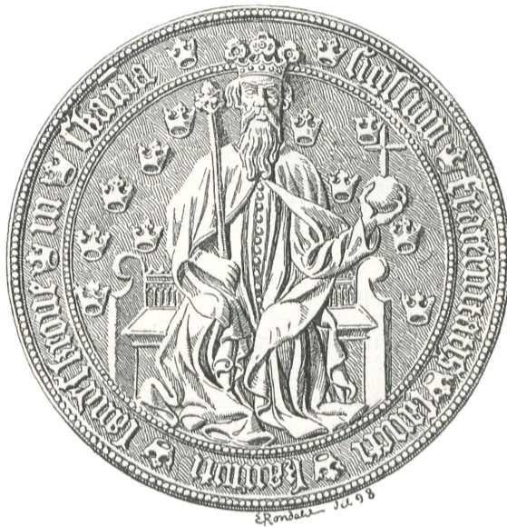
Fig. 20. Landskrone (c. 1420).