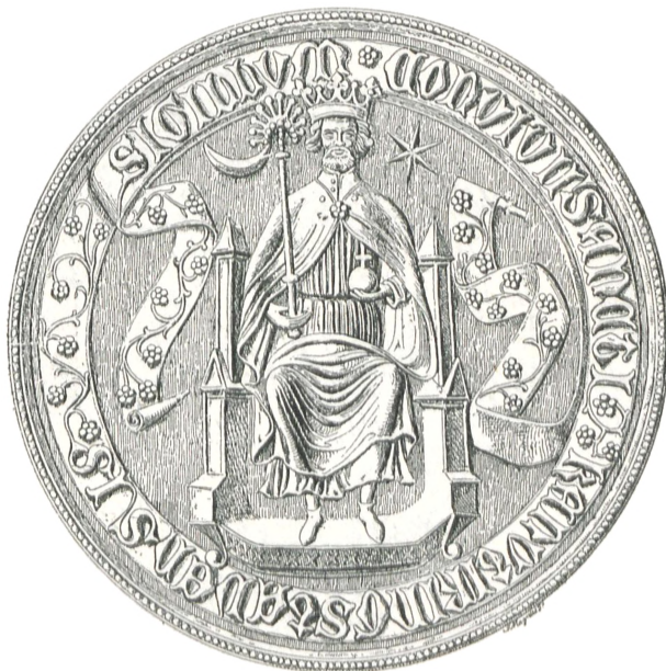
Fig. 10. Ringsted? (c. 1400).

Lund. Fig. 15 er et Brudstykke (i Rigsarkivets Samling) af et virkeligt Segl, der har siddet under et Dokument. Man læser paa det [KA]NVTI LVNDIS.