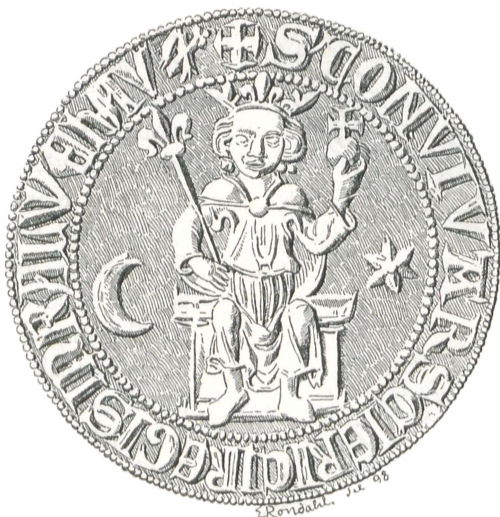
Fig. 7. St. Eriksgilde i Kallehave (c. 1275).

Knuds-Dagene, ligegyldigt om de vare viede Knud Hertug eller Knud Konge 1 . Til Oplysning om Menigmands Stilling til de mange forskellige Helgener kan det i det Hele mærkes, at da der en Gang var Kvægsyge i Halland, kastede sytten Naboer dér Lod om, hvem af de to Helgener de skulde henvende sig til om Hjælp, hellig Oluf eller hellig Knud. Forholdet er saa lidet udpræget, at der tys til Lodkastning, og St. Knud karakteriseres ikke nøjere. Noget Andet er, at da det er en Klosterbroder fra Ringsted, der har hørt Fortællingen og bevirket, at den blev opskreven, er St. Knud, hvem Loddet traf og som naturligvis strax afvendte Sygen, bleven til Knud Hertug i Ringsted 2 . Den Helgen, hvem et Gilde fik Navn efter, er sikkert ofte bleven valgt mere eller mindre tilfældigt. Saaledes synes det i alt Fald at være gaaet med Skolegildet eller Skolelavet i Flensborg 1432 3 , og mærkeligt er det, at Eriksgildet i Kallehave 1266 synes at staa Knudsgilderne saa nær, at det ganske kan til egne sig Skanør-Redaktionen af disses Vedtægter 4 . St. Erik er den 1250 paa en Baad i Slien myrdede Kong Erik Plovpenning. Herom minder Fremstillingen i Seglet Fig. 8, medens