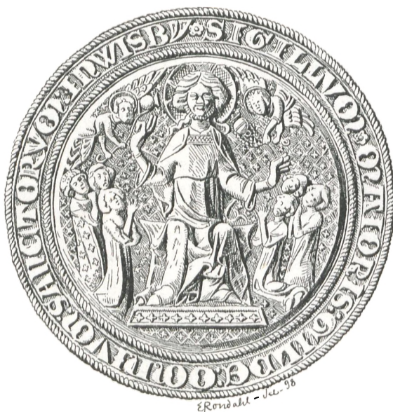
Fig. 56. Alle Helgensgilde i Visby.

Og man viede Gilder ikke alene til »Alle Helgene« men ogsaa til baa- de Treenigheden og Kristi hellige Legeme. Fig. 57 viser et smukt Segl fra et Tre-