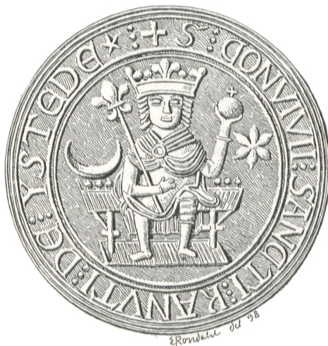
Fig. 16. Ystad (c. 1275).