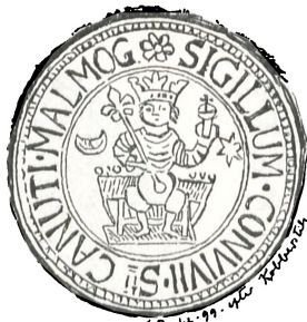
Fig. 23. Malmø.