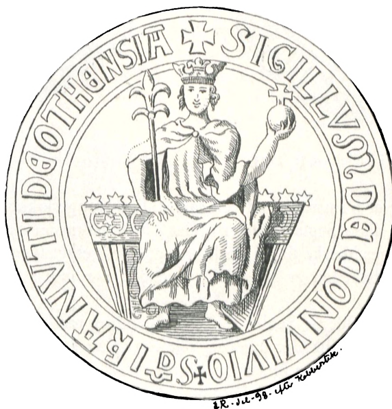
Fig. 6. Odense.