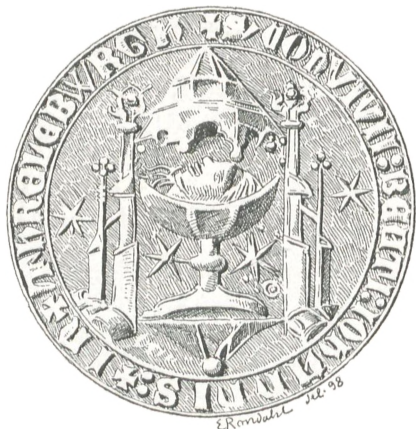
Fig. 46. St. Hansgilde i Trelleborg.

Huor mand kommer i Randers eller Ribe, i Viborg, Aarss, Olborg eller Nibe oc spør, huess er den store gaard eller det skøne huss, her staar,