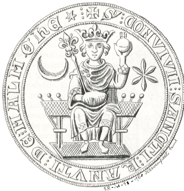
Fig. 25. Malmø.