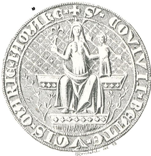
Fig. 37. Mariegilde paa Amager.