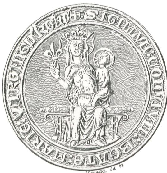
Fig. 42. Mariegilde i Kjøge.

ogsaa har været et Gertrudsgilde i Stubbekjøbing. Omskriften paa det lyder: s[IGILLVM] CONVIVII S[AN]C[T]E GHERTRVDIS IN OPIDO STVBBEKOPY[N]GE.