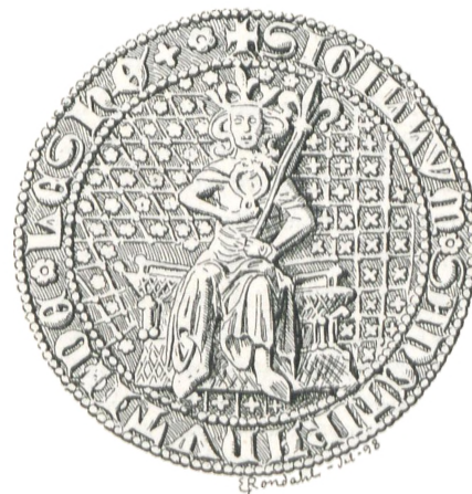
Fig. 17. Læsø (c. 1350).