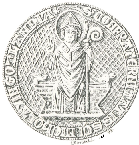
Fig. 38. St. Nikolajgilde i Visby.