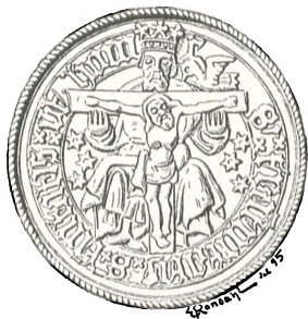
Fig. 57. Trefoldighedsgilde i Odense.

Kristus hængende paa Korset; fra den højre Side af hans Bryst strømmer Blodet over i en Kalk, og paa den anden Side af Korset ere fem Hostier sirligt ordnede, den øverste af dem er mærket med et Kors.