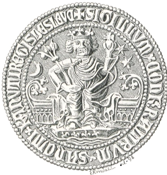
Fig. 4. Slesvig (c. 1325).