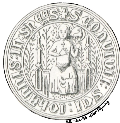
Fig. 45. St. Hansgilde i Snesere.