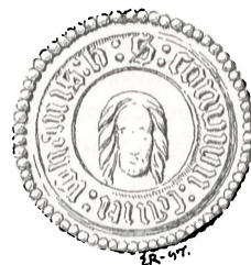
Fig. 47. St. Hansgilde i Svendborg.

ældste, og det har uimodsigeligt tjent som Forbillede, da Gildet i det nærliggende Sølvborg skulde have et Segl. I dem begge sidder den kronede Himmeldronning paa en Trone med Kristusbarnet i venstre Arm, medens hun med den højre rækker det et rundt Legeme (Verdenskuglen?). Kristusbarnet har en Glorie om Hovedet, og paa hver sin Side af Maries Hoved ses en Stjerne og en Halvmaane.