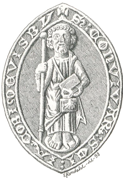
Fig. 52. St. Jakobsgilde i Visby.