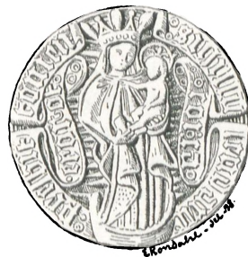
Fig. 44. Mariekalent i Odense.