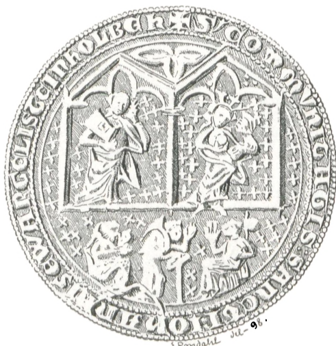
Fig. 48. St. Hansgilde i Holbæk.

Først have vi de saa talrige Mariegilder. Guds Moder spillede, navnlig i Katolicismens sidste Tid, en stor Rolle som Forbederinde. Det er da naturligt, at talrige Gilder viedes til hende, og ikke mindre end fem Mariegilders Segl ere bevarede. To af dem have hjemme i Blekingen, i Ronneby (Fig. 41: SIGILLVM CONVICII SANCTE MARIE DE ROTNÆBY) og Sølvborg (Fig. 43: s[IGILLVM] CONVICII SANCTE MARIE DE SILVISBY). Af disse, to Segl er Ronneby-Seglet formentlig det