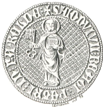
Fig. 50. St. Petersgilde i Færelde.