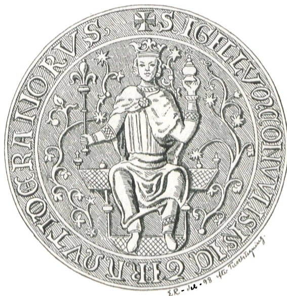
Fig. 28. Randers.

Danmark raadede paa den Tid, der her er Tale om, over baade Gulland og Estland, og begge disse Steder blev der oprettet Knudsgilder. Det smukke Segl (Fig. 31) har Indskriften: s[IGILLVM] TEVTHVNICOR[VM] IN WISBI DE GVILDA s[AN]C[T]I KANVTI (Segl for de Tyske af Hellig Knuds Gilde i Visby), og Fig. 32, der synes at kunne være en Efterligning af Fig. 31, har Indskriften: SIGILLUM CONFRATERNITATIS SANCTI KANVTI DE REVALLA (Segl for Hellig Knuds Broderskab i Reval). Visby var en Hansestad. Det er derfor naturligt, at tyske Handelsmænd spillede en Rolle her, hvad der yderligere bekræftes ved Seglet Fig. 33, hvori der om