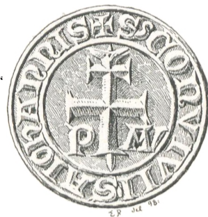
Fig. 49. St. Hansgilde i ?