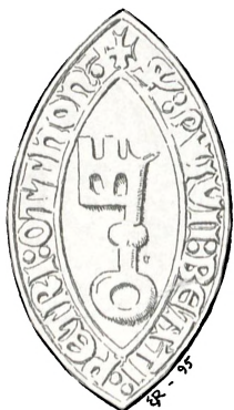
Fig. 51. St. Petersgilde i Odense.