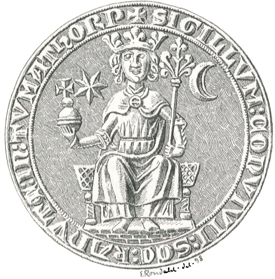
Fig. 12. Tommerup (c. 1275).

Knudsgildet i Ystad. — Landskrone (Fig. 20). Seglet er Aftryk af et Signet i Nationalmuseet. — Laholm (Fig. 21). Ogsaa dette Signet findes i Nationalmuseet.