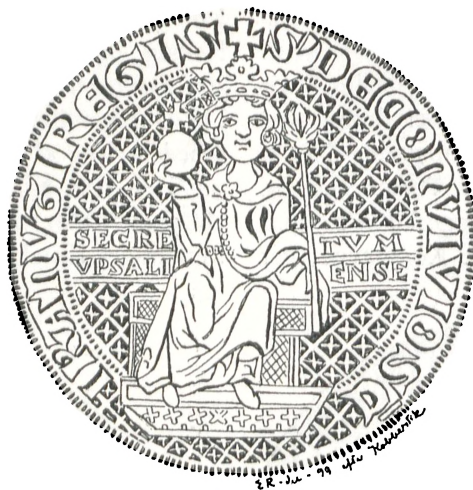
Fig. 36. Upsala (?).

Der er ingen Tvivl om, at de mægtige St. Knudsgilder have henvendt sig til Tidens bedste Seglskjærere. I de forskellige Byer har Knudsgildet sikkert altid været Byens fornemste Gilde, og naar der for enkelte Byer, som ovenfor omtalt, kan paavises to St. Knudssegel, illustreres herved det paagjældende Knudsgildes Udvikling. At den samme By skulde have haft to (eller flere) Knudsgilder, kan næppe antages.