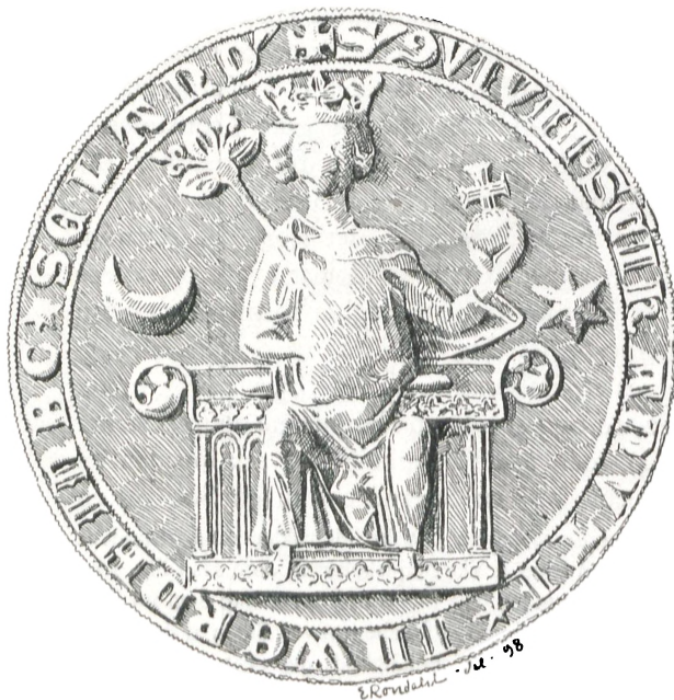
Fig. 19. Vordingborg (c. 1300).

En Ting, der strax kunde synes at være en brugbar Hjælp til at bestemme Seglets ældre eller nyere Oprindelse,