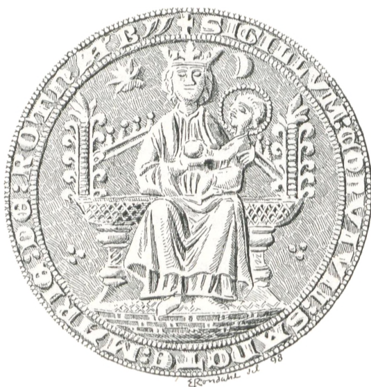
Fig. 41. Mariegilde i Ronneby.

Messer, Bønner o. lign., i anden Henseende Sammenkomster med Spise og Drikke. Vi træffe nu Gilder viede til en Række forskellige Helgener, og navnlig synes St. Gertrud at have været en yndet Helgeninde. 1341 nævnes et Gertrudsgilde i Søborg (?), 1343 et i Odense, 1379 et i Flensborg, 1395 et i Kållundborg, og Seglet Fig. 40 viser, at der c. 1350