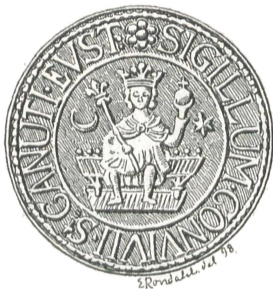
Fig. 22. Ystad.