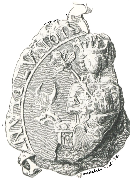
Fig. 15. Lund (c. 1250).