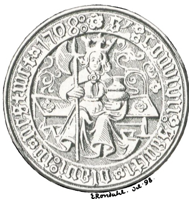
Fig. 39. St. Olufsgilde i Næstved.

lig Erik, den anden for Vor Herre og Frelser, den tredje for Jomfru Marie; 1370 er ingen mindre end Formanden for det store, til Jomfru Maria viede Præstegilde i Lunb Skriver i Byens St. Knudsgilde. I alle Gilder kommer efterhaanden Vægten til at ligge paa Medlemmernes Forsyning med visse aandelige og legemlige Goder, i første Henseende Gravfølge,