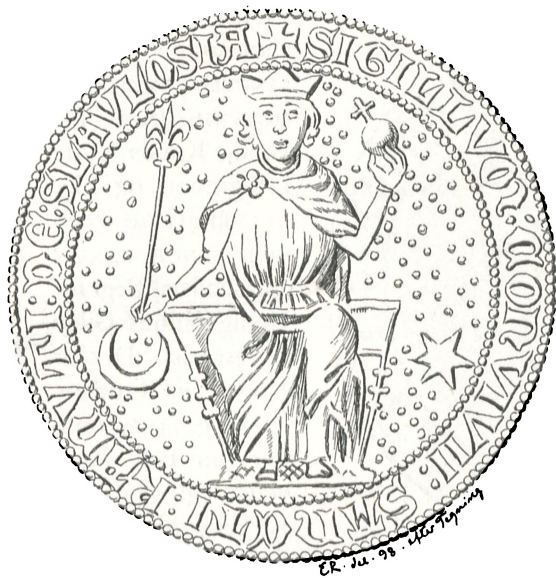
Fig. 26. Slagelse.