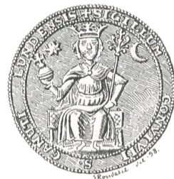
Fig. 24. Lund.

Kobber og et af Bly, og mellem Kobbersig- neterne et, der skrev sig fra et Knudsgilde. Dets Omskrift lød: SIGILLVM CONVIVII SANCTI CANVTI DE SIOBURG 1 , og det har altsaa tilhørt Knudsgildet i Søborg, den nuværende lille Landsby af dette Navn syd for Gilleleje, der i Middelalderen regnedes mellem Kjøbstæder. Søborg-Signetet synes nu tabt, og noget Af- tryk af det kjendes ikke.