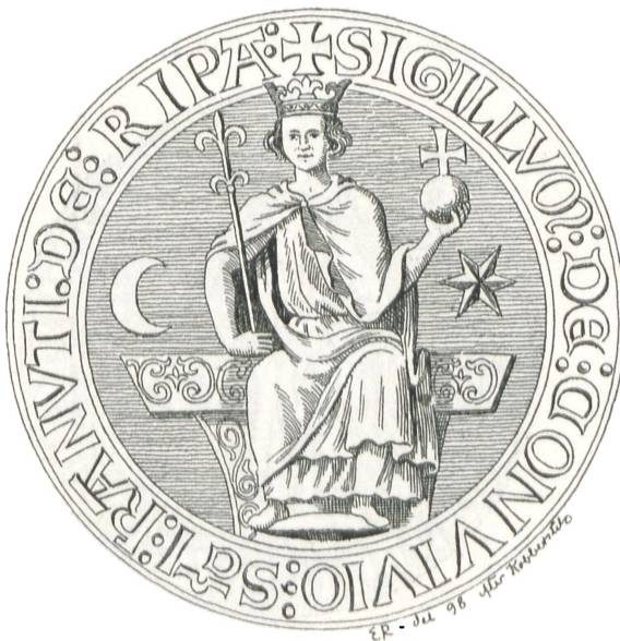
Fig. 29. Ribe.