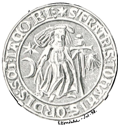
Fig. 53. Jakobsbroderen Johannes' Segl.

i Holbæk, der er viet til Apostelen Johannes. Omskriften lyder: s[IGILLVM] COMMVNITATIS SANCTI IOHANNIS EWANGELISTE IN HOLBE[C]H 1 , og hvad Seglets øvrige Indhold angaar, da ses forneden i det en Munk prædikende fra en lille Pult for to paa hver Side af ham siddende Munke og ovenfor denne Scene i en sirlig Dobbelttramme St. Johannes til den ene Side og Jomfru Marie med Kristusbarnet til den anden. Hele Seglets Bund er bedækket med Smaakors. Da der forøvrigt Intet kjendes til det her nævnte Samfund, hvis Navn paa Latin gjengives med det sjældnere forekommende Udtryk communitas , er det næppe muligt nærmere at forklare Betydningen af Seglets Fremstilling.