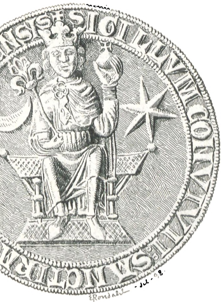
Fig. 9. Ringsted? (c. 1275).

Vordingborg (Fig. 19). Af dette Segl fra WERD'HINB[OR]C SELAND findes et Aftryk i Rigsarkivets Seglsamling.