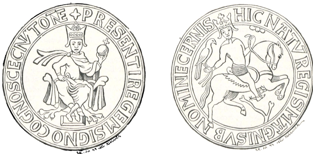
Fig. 1—2. Segl og Modsegel fra Knud den Helliges Gavebrev til Domkirken i Lund 1085.