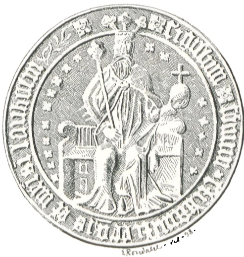
Fig. 21. Laholm (c. 1425).