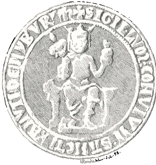
Fig. 30. Nyborg.

paa to Kapitelssegl fra henholdsvis Vesterås 1288 og Upsala 1310 2 , tør Seglet nok sættes til c. 1300, og Fig. 35, paa hvilket Kirkebygningen er videre udviklet, maa da sættes noget senere. Signetet til Sigtuna-Seglet findes i det historiske Museum i Stockholm og til Vesterås-Seglet i Universitetets historiske Samlinger i Lund. Hvad derimod Fig. 36