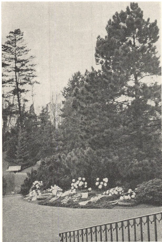
Ella Hedtofts grav på Vestre Kirkegård i København.