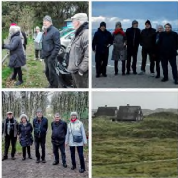
Foto fra fætter-kusinetræf i Henne 2017