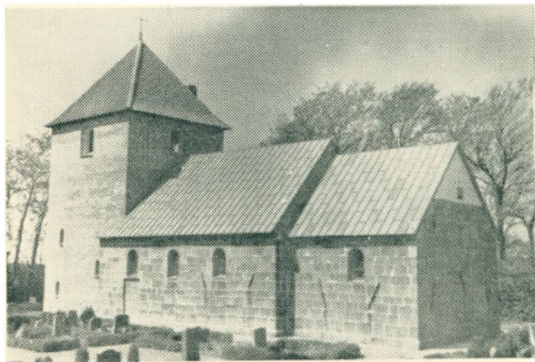
Elso Kirke 1957