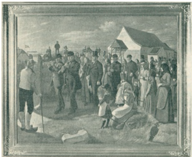
Brudfærd paa Mors. Ved Alsted Kirke. Malt af Hans Andreas Hessellund 1886. (Se Morsø Folkeblad 5. August, 6. August 1957)

Megen Sorg er skjult bag disse Vedføjelser til kære bortgangnes Navne og Aarstal.