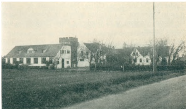
Galtrup Højskole 1930

bl. a. ikke faa fra Hjem, der tilhørte Frimenigheden i Øster Jølby. Han var ogsaa jævnlig paa Foredragsrejser i Thisted Amt og fandt da Lejlighed til at besøge gamle Kendinge i Øster Jølby og Erslev. Han har bl. a. fortalt herom i »Julehilsen fra