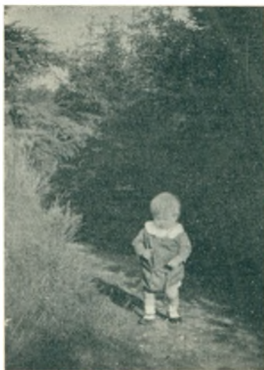
Fra Anlægget ved Præstbro 1929

I 1876 blev der ved Siden af Højskolen opført et stort, ottekantet Forsamlingshus , der er en af de største Bygninger i sin Slags i Landet. Her har uafbrudt hvert Aar siden været afholdt meget store folkelige og kirkelige Møder, hvor grundtvigske Ordførere fra alle Egne af Landet har talt. De har ogsaa altid her haft en meget lydhør Forsamling at henvende sig til.