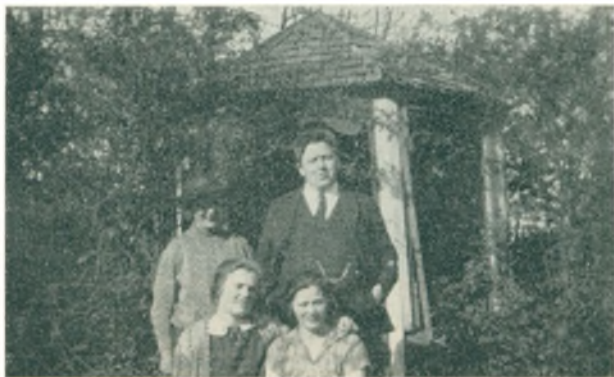
Fra Galtrup Højskoles Have 1927