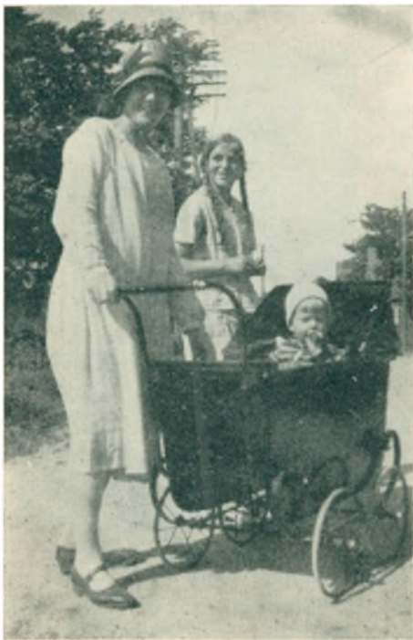
Fra Øster Jølby Gade 1929

ning er meget lidt søgende i den Retning. Ved store Sammenkomster i Øster Jølby kan der købes Kaffe og Afholdsøl i det mindre Forsamlingshus, hvor der er installeret Køkken, saa