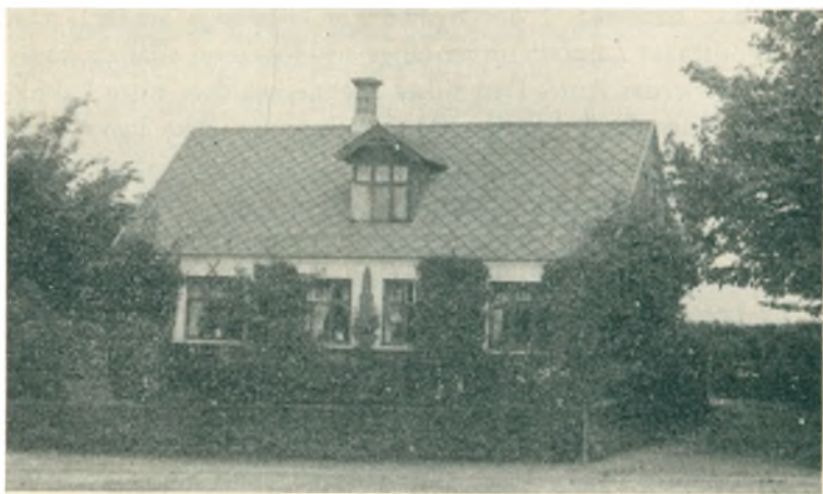
Hus i Øster Jølby, hvor vi boede 1926—30.

gende Marker ved Landevejen mellem Nykøbing og Vildsund. I Begyndelsen af 1840'erne var der kun bygget én Ejendom Nord i Sognet, det nuværende Præstbrohus , der ligger paa Øster Jølby's Grund, men dens meste Jord hører dog til Galtrup Sogn Nord derfor. Landevejen fører nemlig gennem den yderste