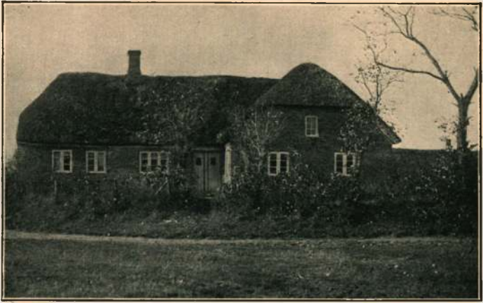
Estvad gamle Skole