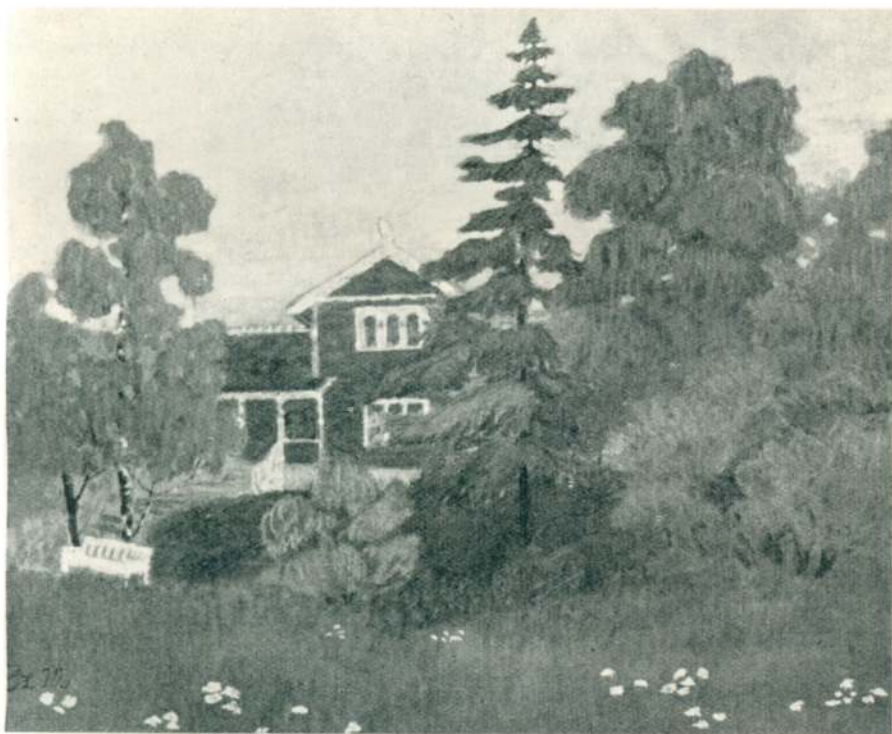
« Mon Plaisir. »