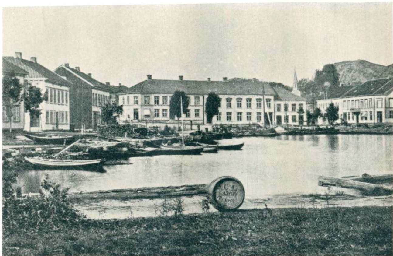
«Oster-Risør 1875, indre havn med torvet.» Midt på billedet sees min farfars senere fars — hus.