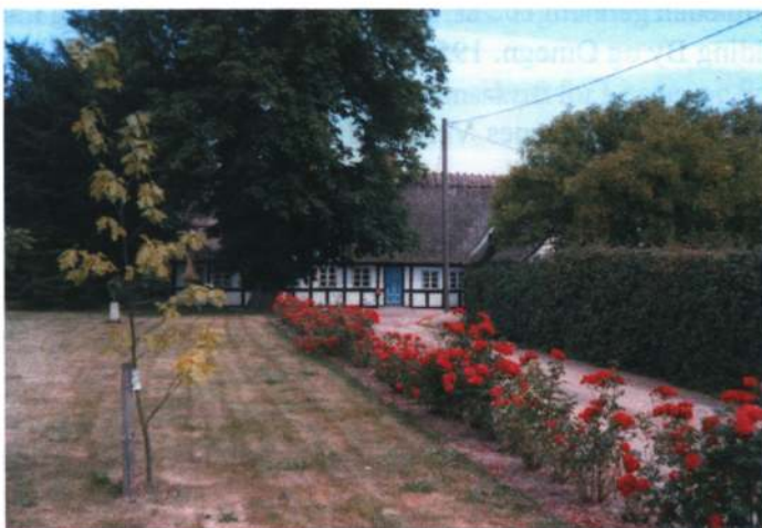
Gudbjerg i juli.