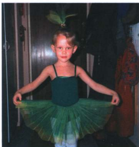
Line danser ballet 1995.