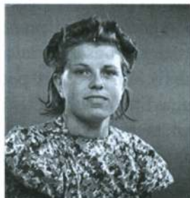
Pigen fra Lemvig 1941.