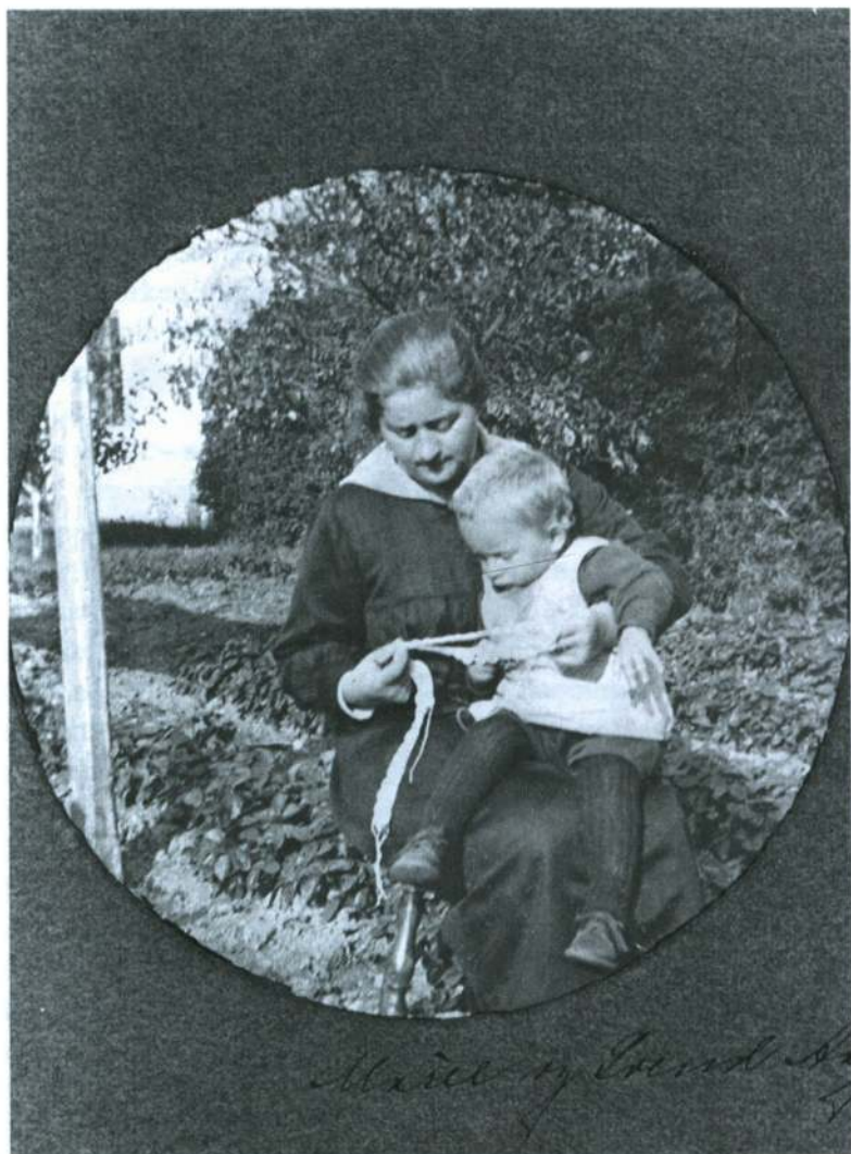
Min mor og mig selv o. 1921.