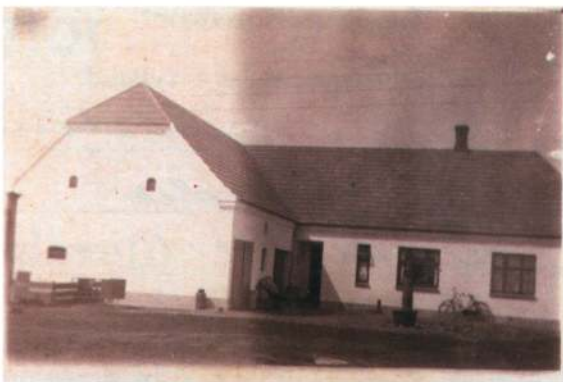
Barndomshjemmet i Hessellund.