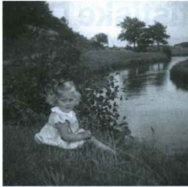
Lone ved Holsted Å 1951.