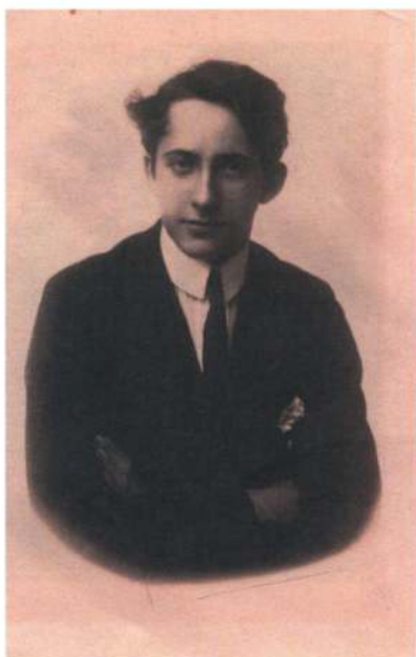
Min far o. 1918.