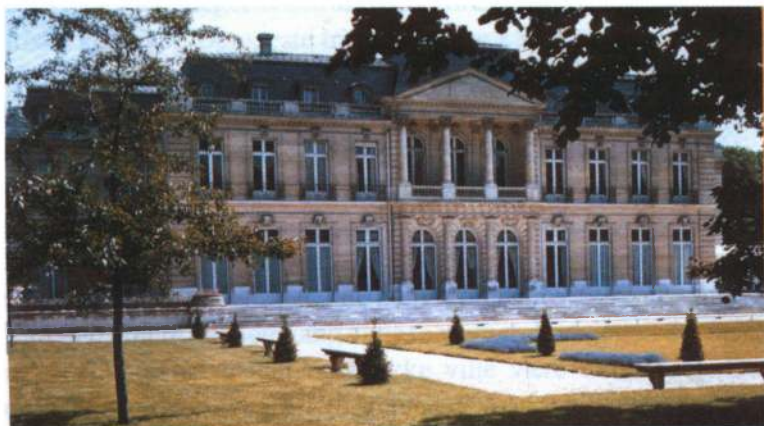
Chateau de la Muette.