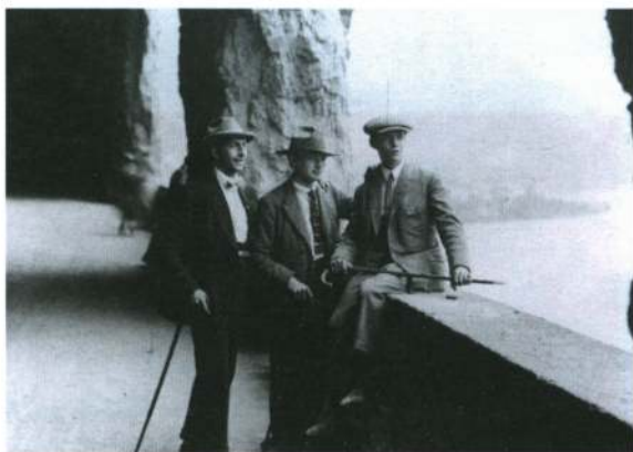
Min far (til venstre) på valsen o. 1922.