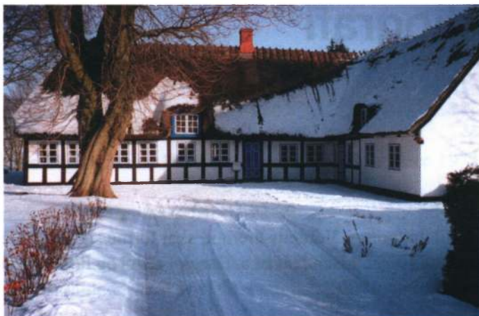
Mit hjem i Gudbjerg 1971-1999.