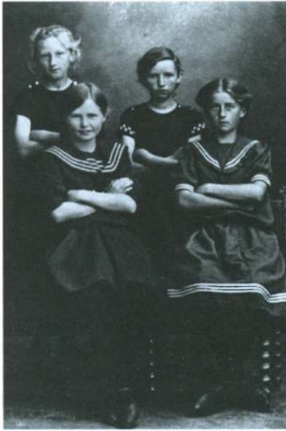
Gymnastpiger, Vejen realskole o. 1914. Min mor yderst til højre.