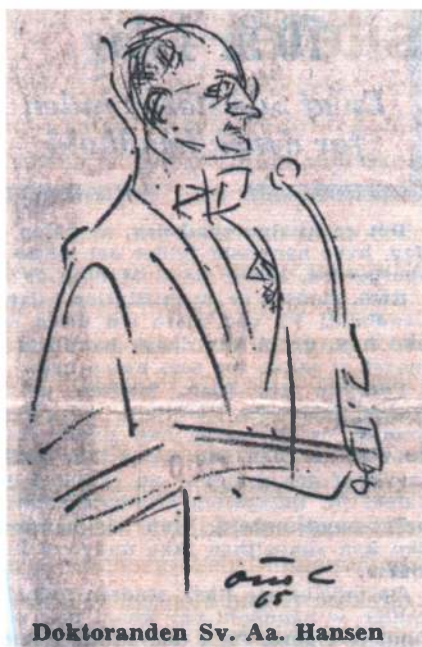
Tegning af Otto C.