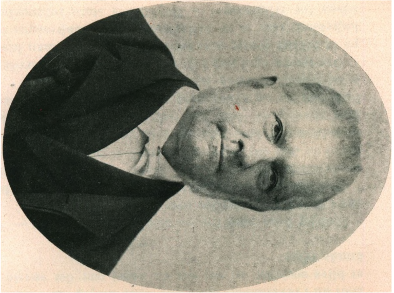
Christian Brücke. 1. april 1887.