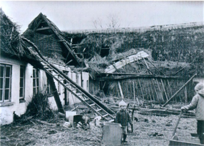
Sådan så taget ud efter den voldsomme storm i 1967, der ødelagde store dele af det gamle stråtag.