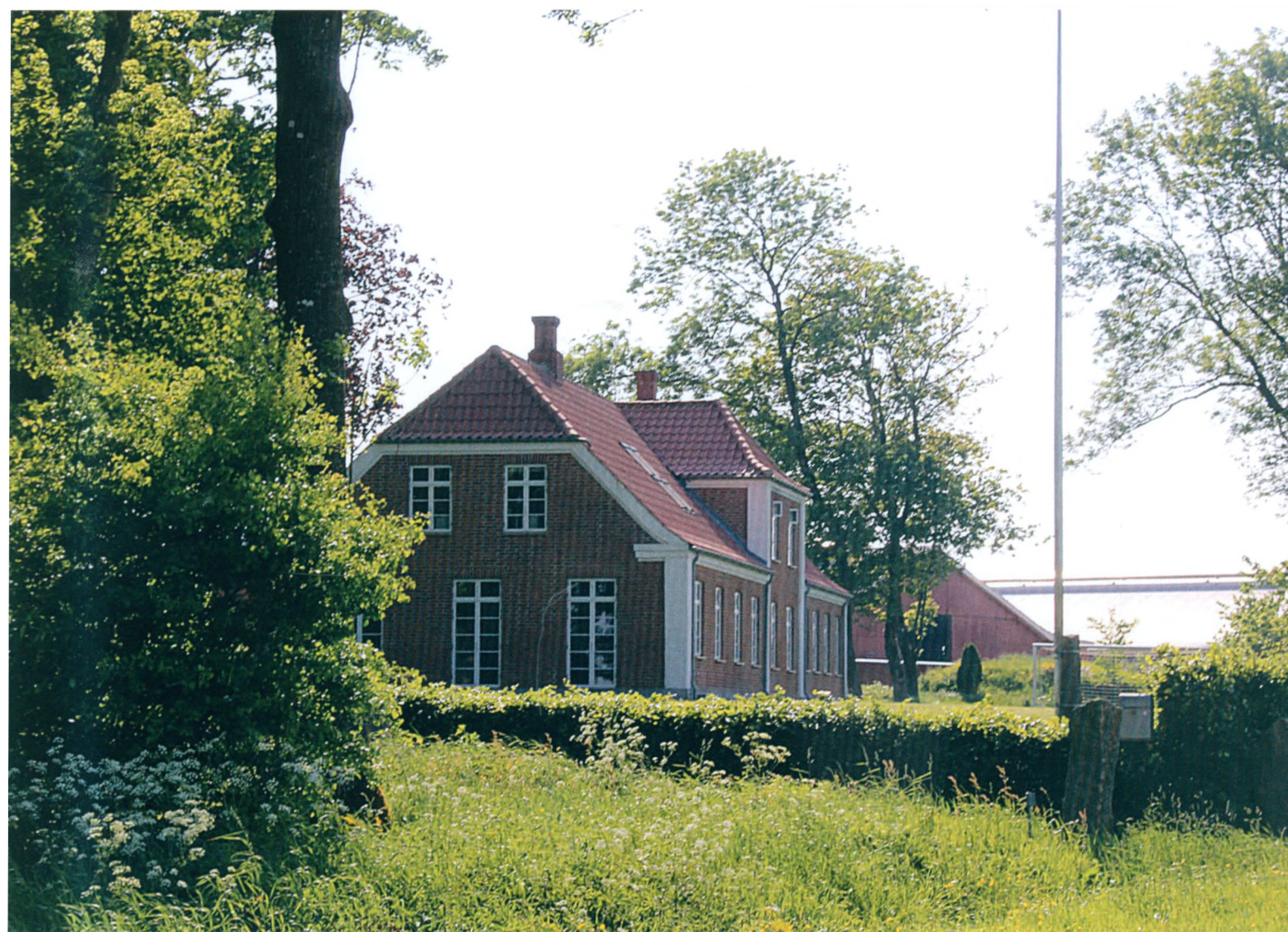
Store Hestbjerg ved Nr. Felding