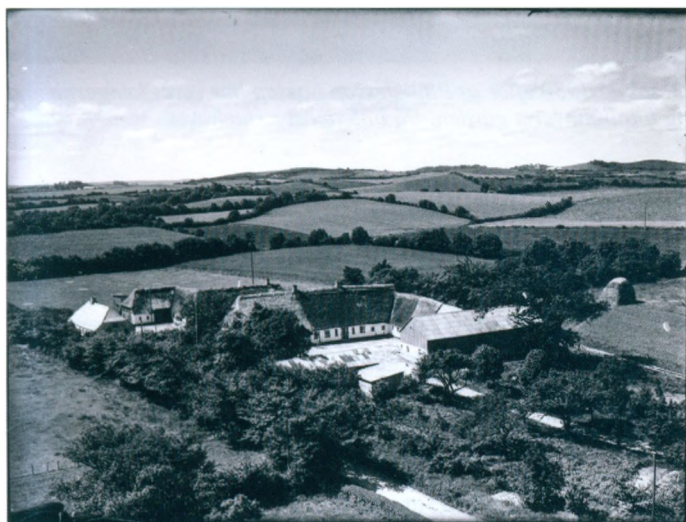
Luffoto af Nørre Fogedgaard i år 1951