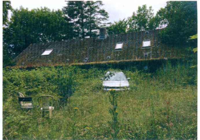
Nørre Fogedgaard fotograferet i juli 2019, da jeg var i Løjt. Et trist syn.