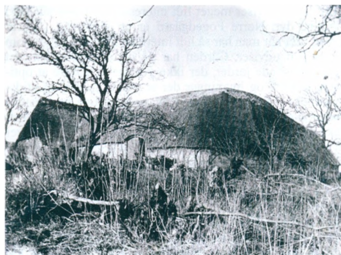
1 Citat fra 'Gårde og Slægter i Løjt Sogn' af Jes M. Holdt, 1982.

Nørre Fogedgaard fotograferet af lokalhistoriker Jeppe H. Riis i omkring år 1900, da gården stadig var firelænget.