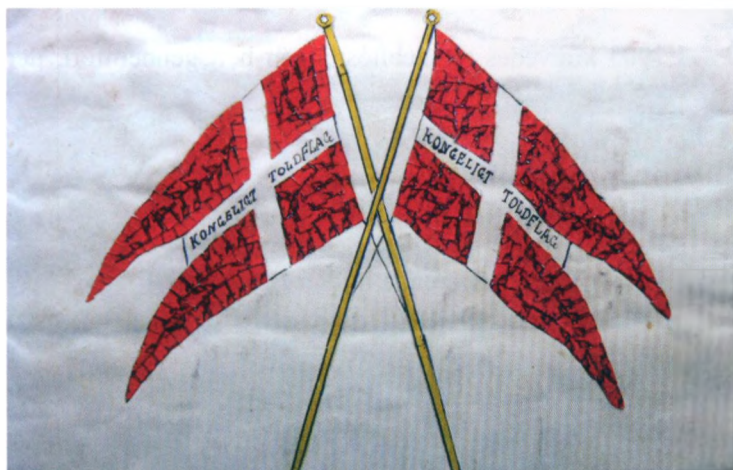
Slagelse toldkammer, udsnit

Meget er i tidens løb blevet gjort for at fremme salget af julemærker. I postetaten begyndte man f.eks. tidligt