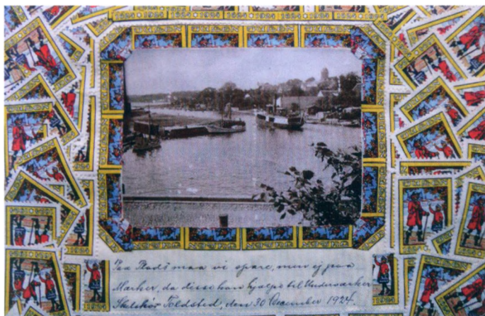
Skælskør toldkammer, udsnit

at lave særlige vandrebøger med omfattende brug af julemærker, og denne tradition blev overtaget af flere andre embedsmandsmiljøer. Det drejede sig om hæfter, der blev sendt i cirkulation mellem de enkelte embeder eller afdelinger, så man hvert sted kunne sende en hilsen til kollegerne ved hjælp af julemærker. For at bruge massevis af mærker blev de ofte klippet i stykker, og de små enkeltdele blev herefter udformet som farverige motiver, der som regel blev suppleret med en kortere eller længere tekst, f.eks. et digt.