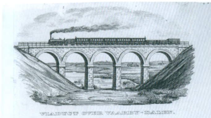
Viaduct over Vaarby-dalen / Vårby banebro 1856.

overtaget af det nystiftede firma Alliance Jernstøberi og Maskinfabrik, som mange af byens håndværksmestre stod bag.