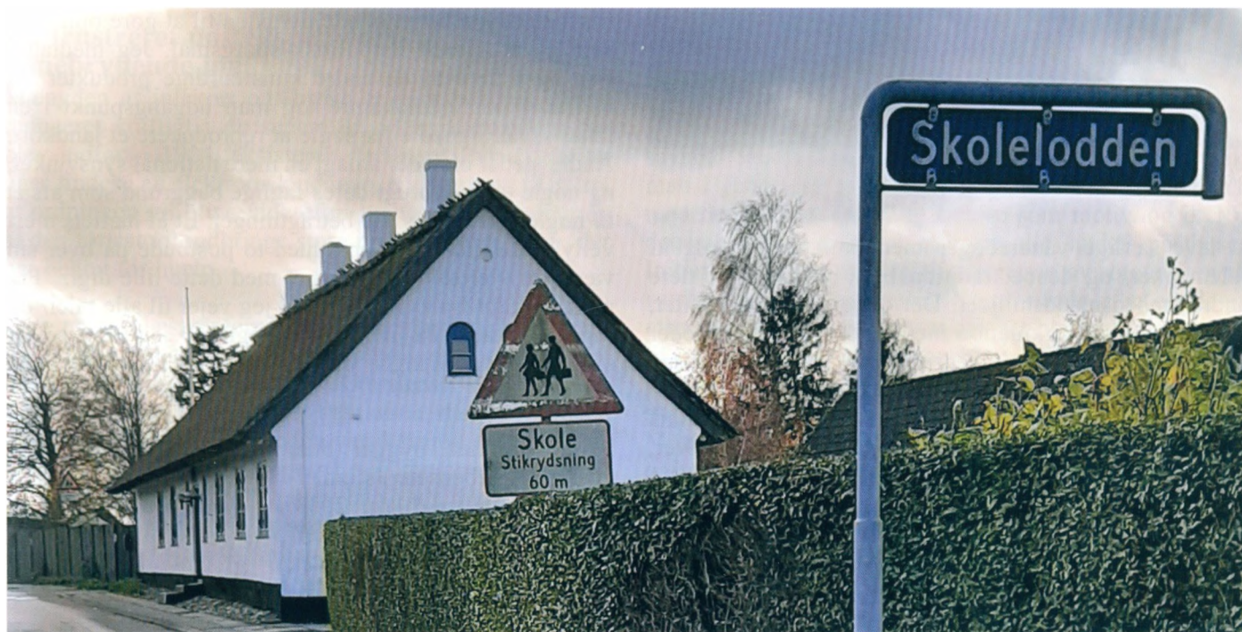
Uvelse gamle rytterskole ved skolelodden. Navnet er bevaret i gadenavnet.

En del af landsbyskolernes virksomhed – især i 1800 årene.