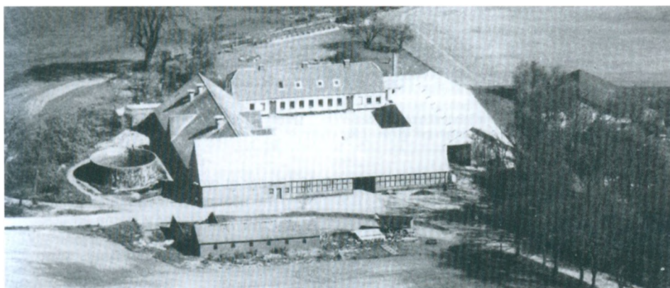
Jægergården o. 1990.