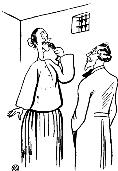
»Den lange Skraa«.