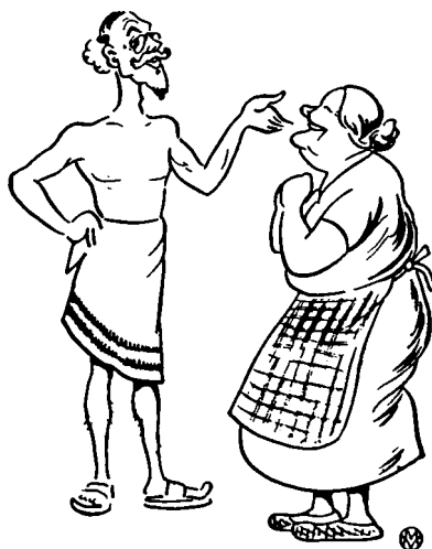
»Danmarks smukkeste Mand.«

Og siden har Forholdet mellem Sverige og Danmark været upaaklageligt. —