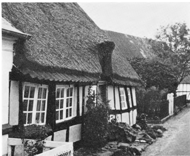
Æroisk Landsbyhus fra Begyndelsen af 18. Aarhundrede.

saa fast en Borg“ og lyste Velsignelse over Husfolket. Da det vor forrettet, gik de ind i de andre Kamre, hvor Spøgelset havde ladet sig „fornemme“, og Husfolket fortalte og viste, hvad der var vederfare dem. Der hørtes intet ondt, mens de var der, hvad der varede omkring 3 Timer. Husfolkene undrede sig over, at der ikke skete noget, da det tidligere, naar Naboerne sang den førnævnte Salme „Vor Gud han er saa fast en Borg“, plejede at buldre. Husfolkene fortalte ogsaa, at de om Natten havde hørt Lyde, som naar nogen smasker med Munden og vil til at snakke, denne Smasken blev ogsaa derefter tiere hørt.