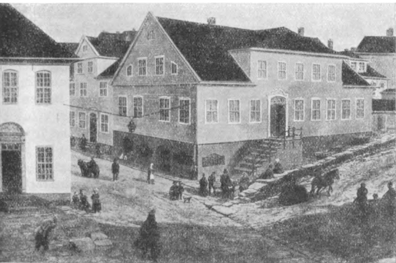
C. J. Hambros hus på nedre hjørne av Strandgaten og Muralmenningen. (Efter maleri av I. C. Dahl, 1840.)

Omkring 1840 vokste der op en ganske betydelig tekstilindustri både rundt Kristiania og Bergen; fore-