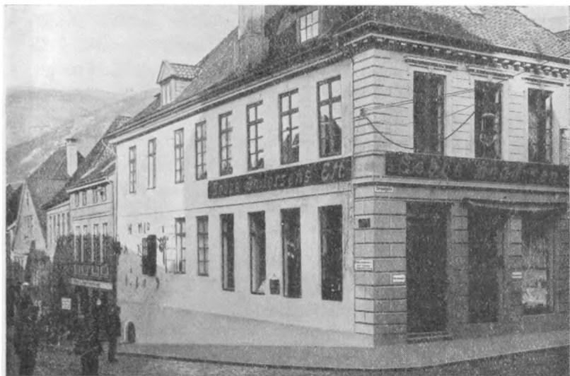
Audunargaarden. 12. rode nr. 5 a sett fra Smørsalmenningen.

Audunargård, 12. rode nr. 5 a, beliggende på den indre, nedre side av Strandgaten, på hjørnet av Smørsalmenningen. Denne gård har sitt navn efter Audun Hugleikson Hestakorn, som fikk den av kong Erik Magnusson. Han blev under Haakon 5 Magnusson fengslet i Bergen 1299 og hengt på Nordnes 1302. I den anled-