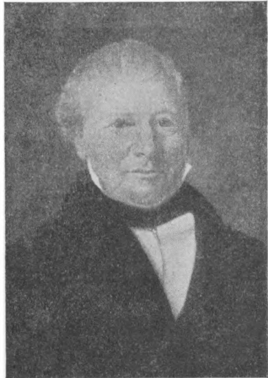
Kjøbmenn Edvard Isach Hambro. (Efter maleri.)

Iallfall blev Hambro boende i Bergen, uten at man vet hvad han tok sig til, til langt ut på høsten; da synes imidlertid opholdet å være blitt så pass ubehagelig for ham at han må ha bestemt sig til foreløbig å reise sin