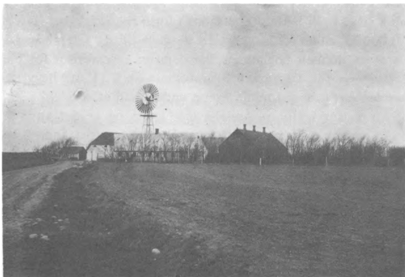
Toftegaard (ca. 1918)