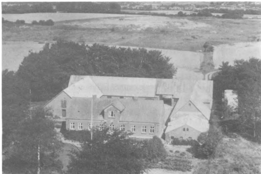
Nyhavegaard (ca. 1950)