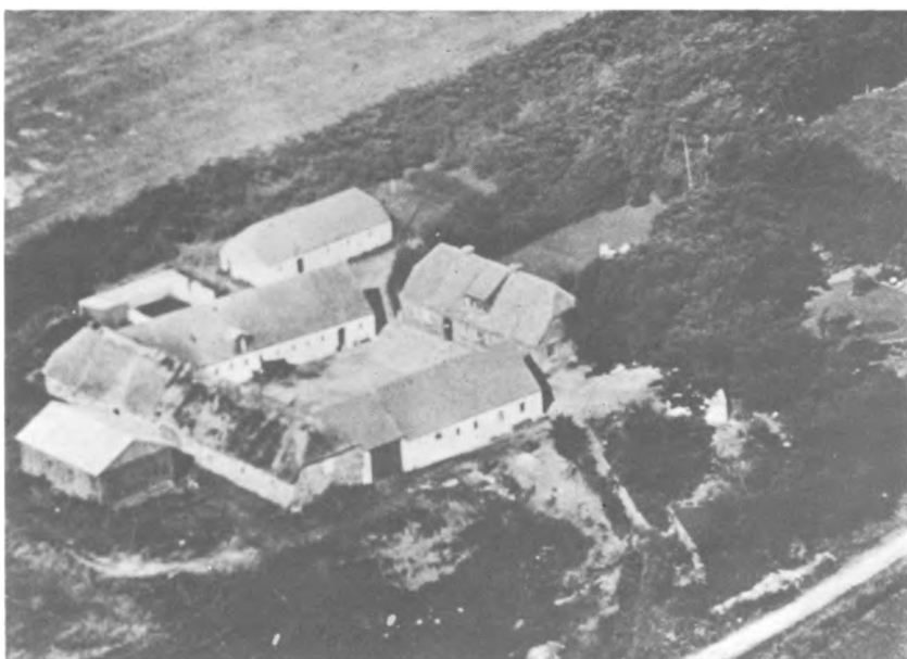
Krogsagergaard (ca. 1947)