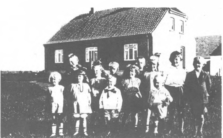
Stougarndsminde (ca. 1928)