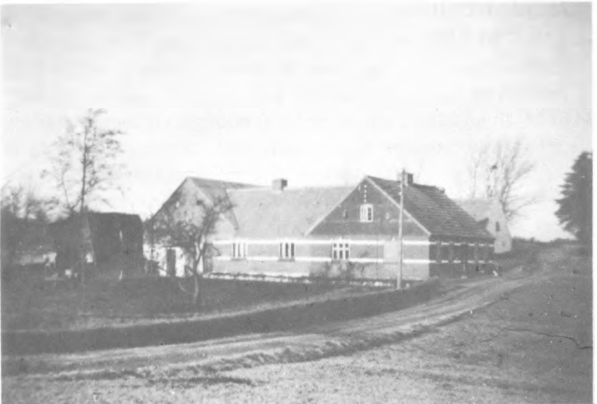
Brøndum dal (ca. 1946)