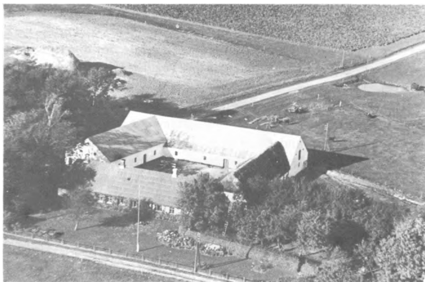
Nørremarksgaard (ca. 1946)