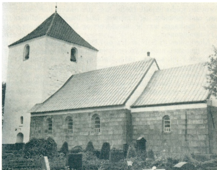
Vester Assels Kirke

Vester Assels Kirke , der ligger ca. 17 km SV for Nykøbing, har sin Plads på en Højning i Byen. Kampestensdigerne, som