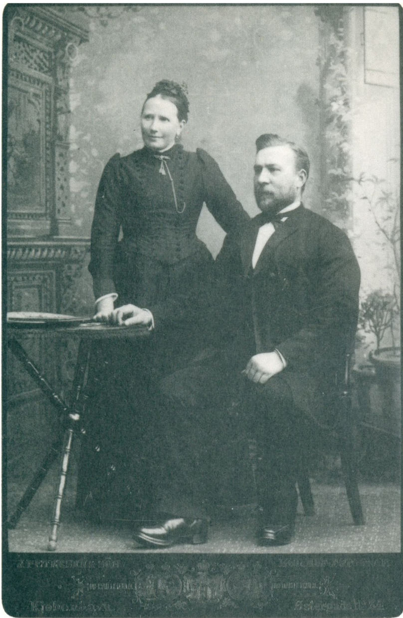
(Stamparret fotograferet 1892)

Med disse lidt spredte bemærkninger om stamfaderen og hans ægteviv, der holdt meget af sine børnebørn (det var rart at komme over til hende i begyndelsen af min tilværelse og blive maadet med kartoffelmos og at få en gyngetur i den store gyngestol med jerngængerne) vil jeg slutte denne udgave af fortegnelsen over deres efterkommere.