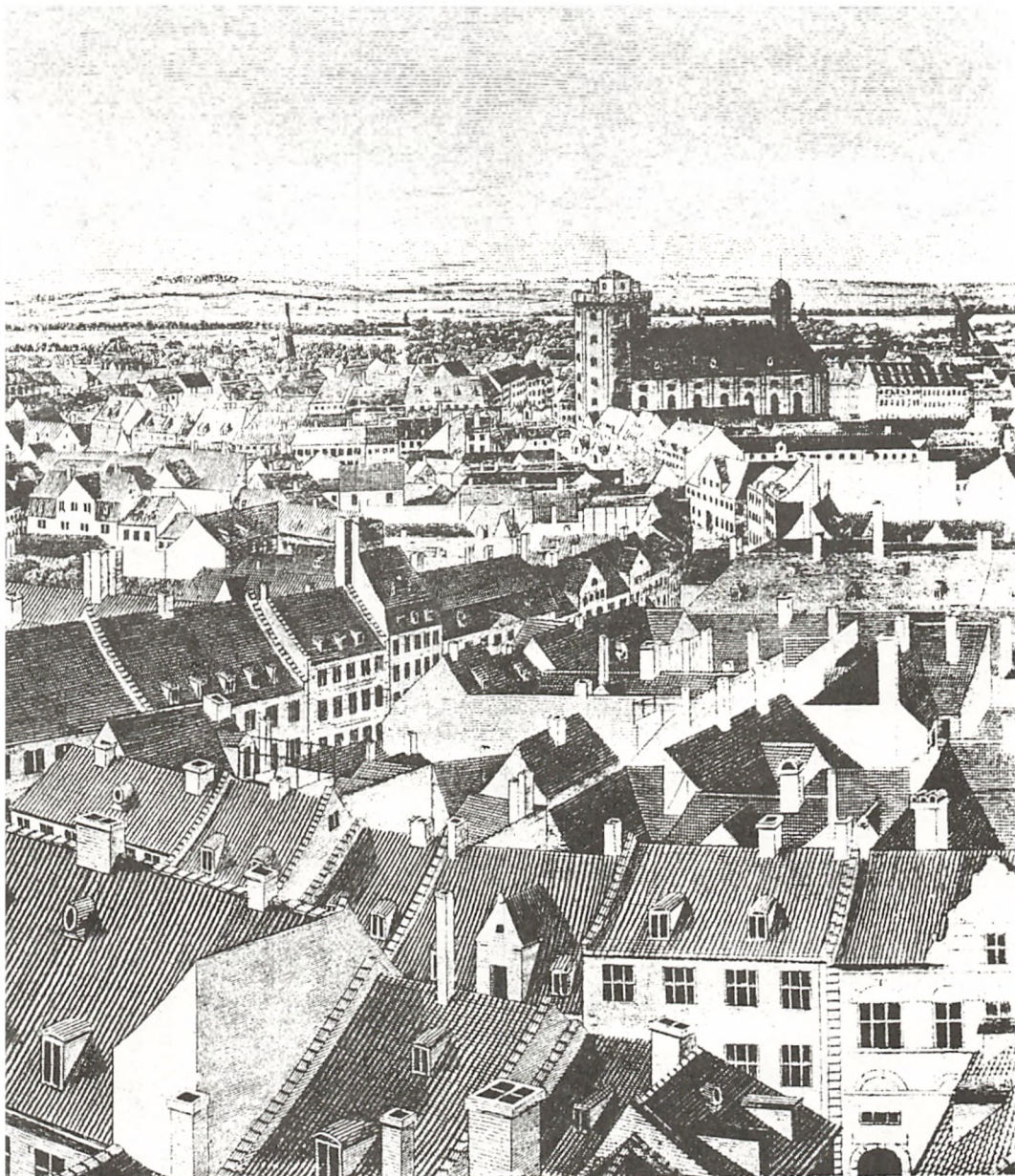
(Udsigt mod vest og nordvest fra Nikolaj Tårn H. Petersen 1837)