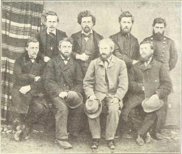
Hindholmlærerne 1869. *)