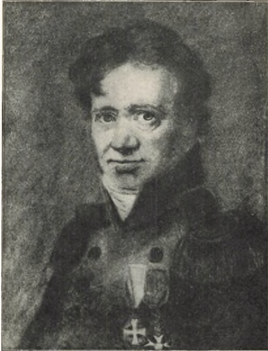
Kontreadmiral Cornelius Wleugel. Efter pastelmaleri (Privateie).

1. Cornelius Wleugel. F. i Kjøbenhavn 16. okt. 1764, blev sjøkadet i 1778, sekondløjtnant i den dansk-norske marine i 1782, premierløjtnant i 1789, kapteinløjtnant i 1796, kaptein i 1803, kommandørkaptein i 1810, kommandør i 1815, og kontreadmiral i 1828. I aarene 1788 til 1791 bistod han sin far med administreringen av orlogshavnen. 1791—94 interimsekvipagemester,