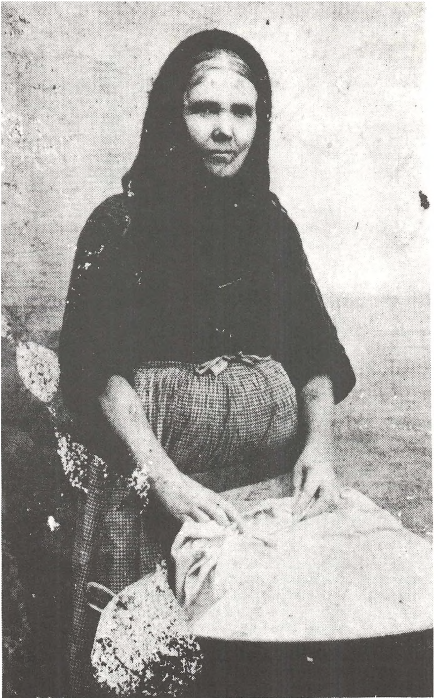
Vaskekone på »Arresødal« og »Marienborg« (1908)