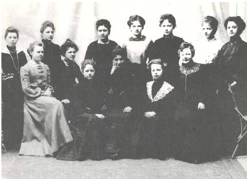
Unge syersker i Systuen i Adelgade (København 1910)

overvejende grad unge eller gifte. De ugifte læser fortrinsvis højreblade eller slet ingen. Også kirkens agitation undersøges. Mere end 2/3 svarer ja til, at de går i kirke. Af resten siger halvdelen nej, og den anden halvdel undertiden o.l., og det ser ud til, at kirkegang øger tilfredsheden. Det er sikkert rigtigt.