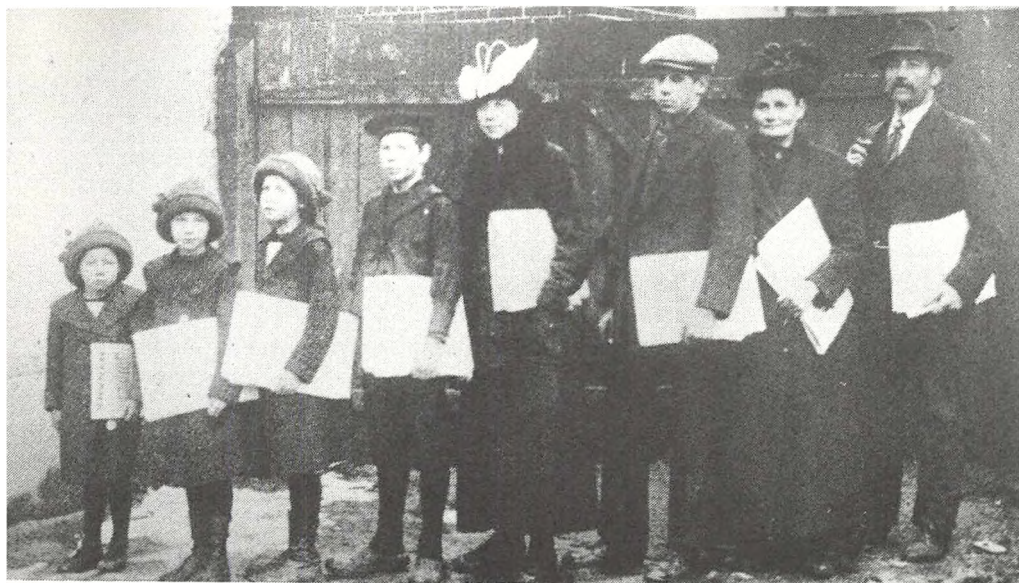
Arbejderfamilie uddeler »Socialdemokraten« og »Ravnen« (1915)

nes side; de skulle spise lidt mindre smør og mere margarine og ikke så meget wienerbrød!! 19