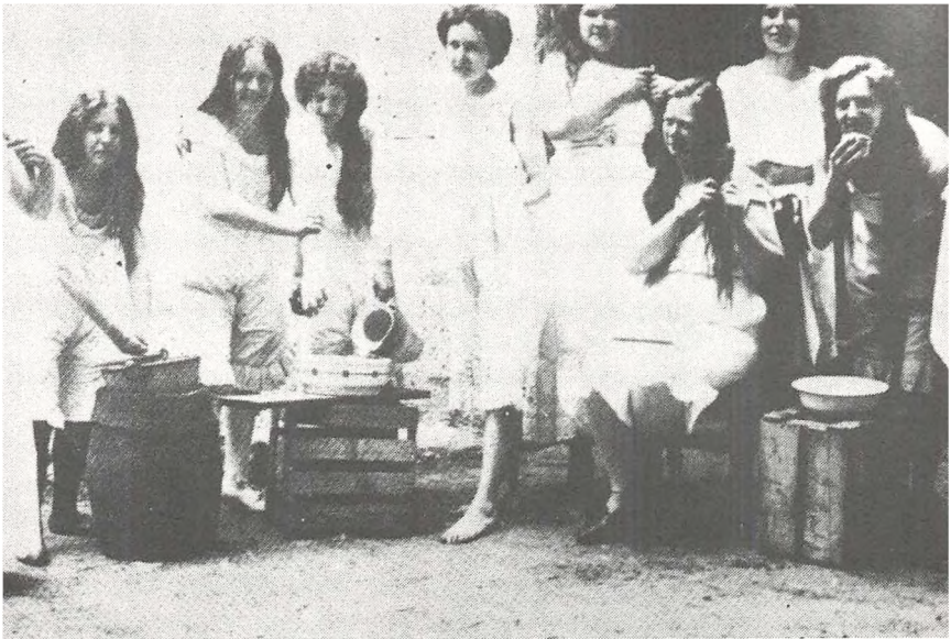
Tobaksarbejdere på et tiltrængt ferieophold (1910)

har set på. Alligevel er det bemærkelsesværdigt, at KF så konsekvent stiller spørgsmålet om sammenhængen ml. kvindesagen og arbejdsagen på dagsordenen – man fastholder at kvindefrigørelsen også er en forudsætning for en socialistisk samfundsomvæltning.