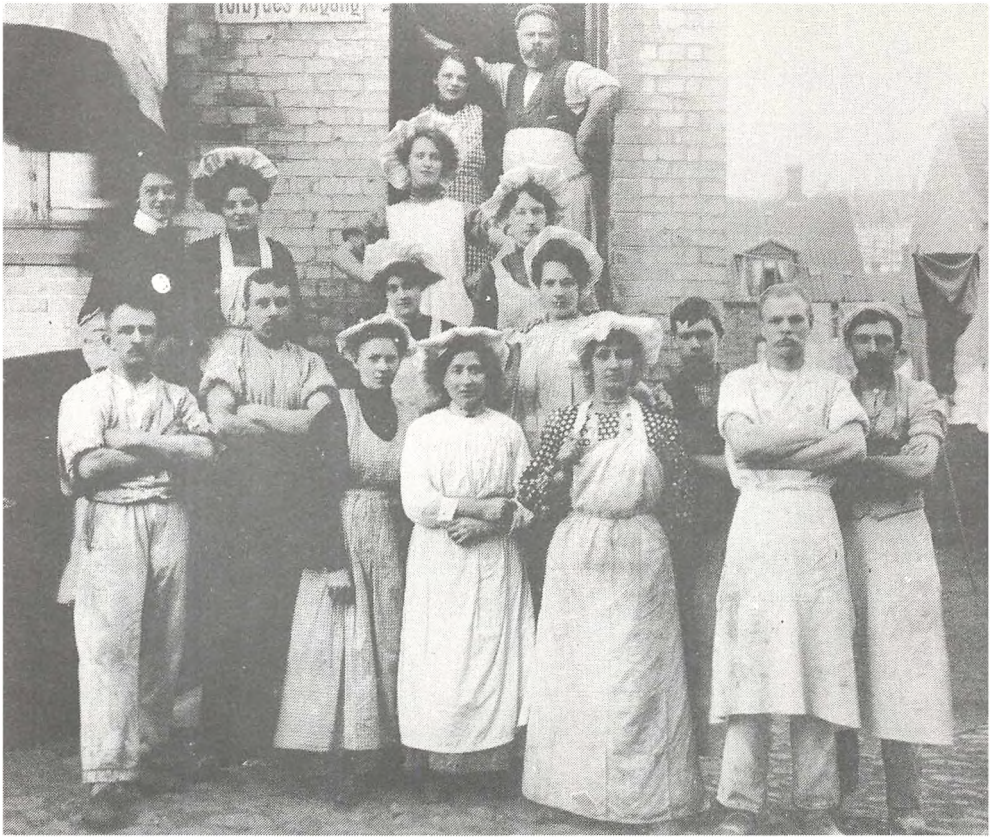
Arbejderne på Kiksfabrikken Globus (1905)

ad b) Hvis vi f.eks. ser på tobaksindustrien, så er den netop et eksempel på, at det bliver muligt at inddrage kvinder i produktionen, ikke via mekanisering, men via en udvidelse af arbejdsdelingen indenfor den manufakturrelle produktion 7 .