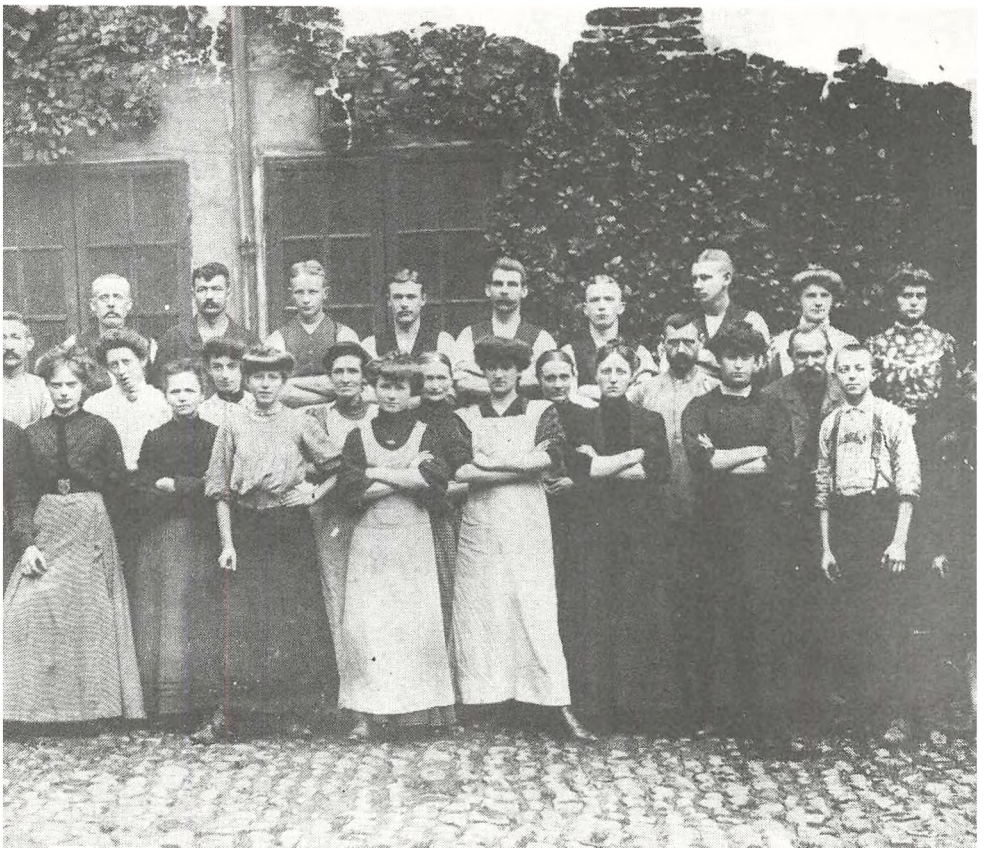
Arbejderne på Tobaksfabrikken Sørensen og Co. omkring århundredskiftet

Parallelt med at den historiske udvikling tvang den politiske ledelse af Internationale til at anerkende kvindearbejdets nødvendighed, blev kvinderne også organiseret i fagforeninger. Karakteren af disse første kvindefagforeninger var taktisk set fra mændenes side – forstået på den måde, at det var de faglærte mandlige arbejdere som tog initiativet til at organisere