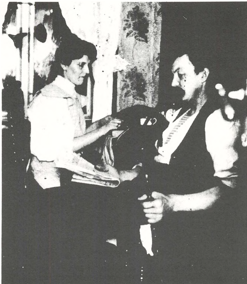
Tobaksarbejderske ruller cigarer i hjemmet (1908)

Af disse to udbytningsformer var hjemmearbejdet nok det mest udbredte. Hjemmearbejdet fik især fodfæste blandt de indvandrede kvindelige førstegenerationsarbejdere, der var vant til at arbejde isoleret, med lange arbejdstider og dårlig løn.