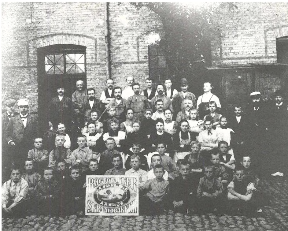
Tobaksarbejdere (Århus 1886)

I byerne var produktionsstrukturen endnu i begyndelsen af 1870'erne helt domineret af håndværk og industri. Håndværket var helt domineret af den faglærte arbejder. Maskinerne havde endnu ikke revolutioneret produktionen i industrien. – Den var stadig manufakturmæssigt drevet – baseret på en udviklet arbejdsdeling mellem faglærte og ufaglærte.