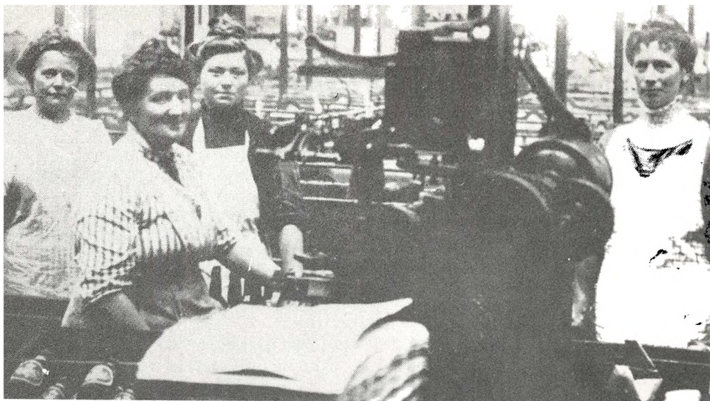
Bryggeriarbejdskvinder fra omkring århundredeskiftet (sted ukendt)

generelt, så hænger det sammen med, at det reelt har været på denne led, at problemerne har været størst og på denne led, at kravene har gået.