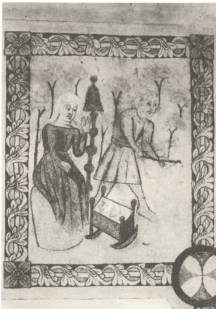
Huslig idyl. Konen (Eva) har travlt med at spinde på sin ten, men har samtidigt vuggen stående inden for rækkevidde. Adam og Evas jordeliv på korets nordvæg. Ørum kirke, Bjerge b. (Vejle amt). Det af rankeværk smukt indrammede billede har ikke tidligere været publiceret.