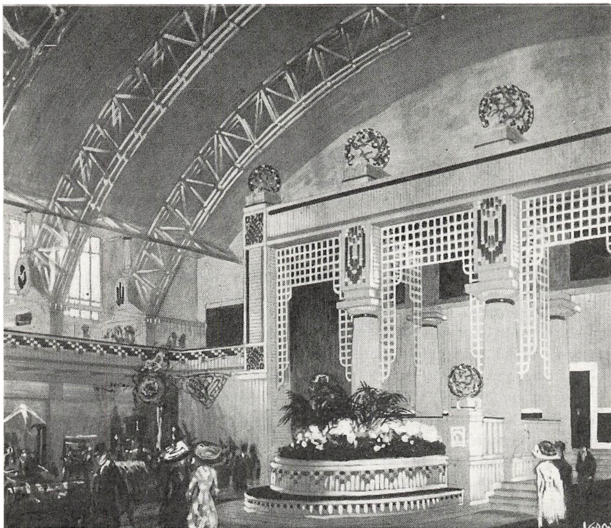
Landsudstillingen i Århus 1909. Motiv fra industrihallen. Gouache af Valdemar Andersen, ca. 92 × 110 cm (mus. nr. 845:69). Gave fra kunsthändler Gunnar Wandel, København.

i Borgmestergården – var arrangeret i julen. Desuden har museet medvirket ved Århus byhistoriske Udvalgs udstilling »Århus Revy – By og bystyre 1869–1969« i Århus Rådhusal 22. februar–6. marts, og ved Danmarks folkelige Broderiers udstilling »Gamle østjyske Håndarbejder« i Århus Rådhusal 19.–27. juli.