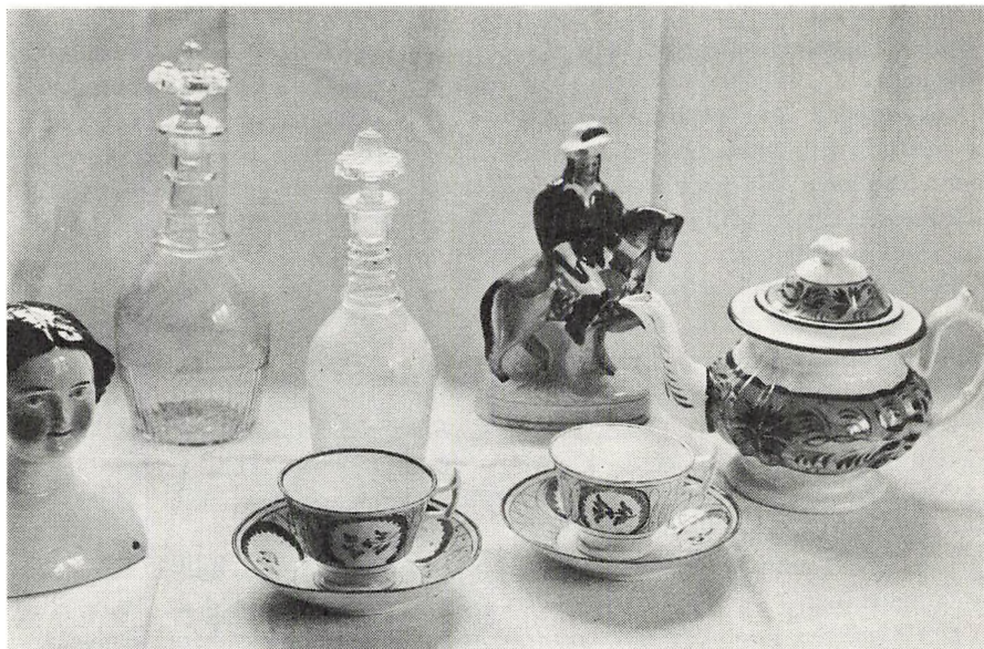
Langelands Museum. Engelske fajancer, danske karaffer og dukkehovede fra 1800-tallet. Indgået 1969.