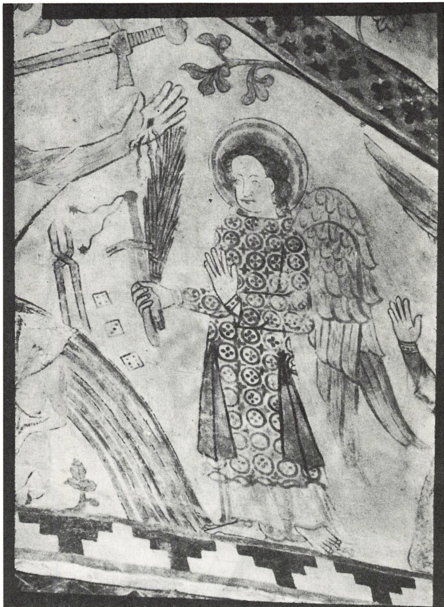
Har man raflet »7« i 1350? De tre terninger, som indgår i Jesu lidelsesredskaber, står på det ret så høje slag »7 med 6« – men det kan jo også blot bero på at maleren ville vise tre forskellige antal øjne. Birkerød, Frederiksborg a., 1325–50.