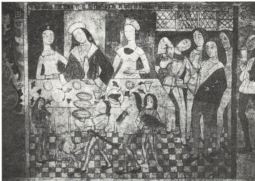
Det er meget sandsynligt, at man hos »den rige mand« har haft så mange tjenere og opvartende smådreng, men vi vil vel mere hæfte os ved klædedragtens detaljer: pigernes hatte, den enes brystduk og mændenes »T-shirt«. Det er også værd at notere det bomærke, som er indfældet i de blyindfattede ruder. Karmeliterkloster, Helsingør, ca. 1500.

De menige soldater kommer for at arrestere Jesus i Getsemane have – i Hørve som en skov af lanser – mens barnemordsscenerne giver plyndringsstemning. De fredelige håndværkere finder vi, når Noæ sønner skal bygge arken (Kirkerup, Lyng), eller ved Golgatha hvor naglerne skal smedes og huller bores til (Gislinge, Sulsted). I Århus domkirke står S. Eligius i sin smedie, og i Vigersted er S. Knud Hertug omgivet af »skindere og skrædere«.