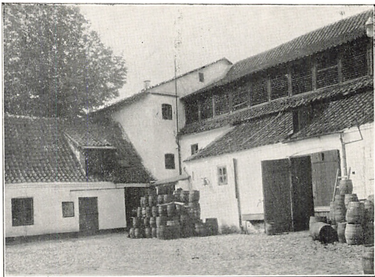
Bryggergaarden i Grenaa.