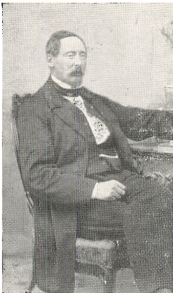
Jacob Emil Krogh. 1822—1902. Side 145.