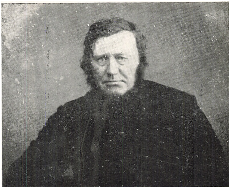
Christian Krogh. 1812—1885. Side 173.