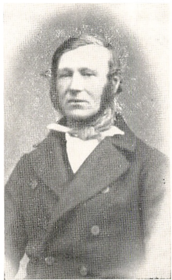
Johan Christian Krogh. 1818—1911. Side 101.