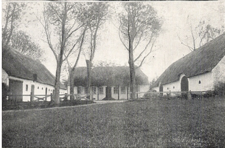
Øverst: Egidius Holms Ejendom i Christiansfeld. Bygget af Herrnhulterne 1794. Side 30.