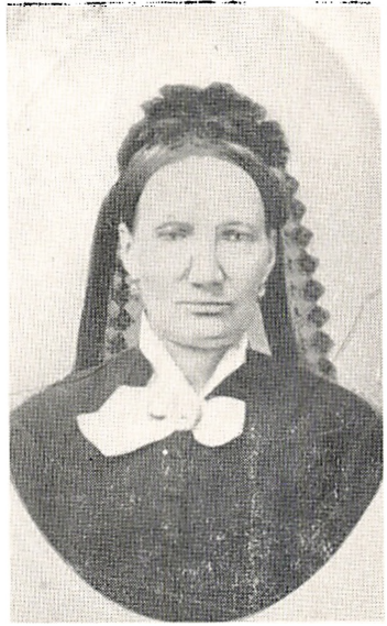
Vilh. Jørgine Frederikke Laureberg. 1821–88. Side 112.