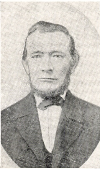
Asmus Emil Anton Krogh. 1822–80. Side 112.