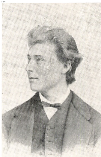
Viggo Krogh. 1848—1925.