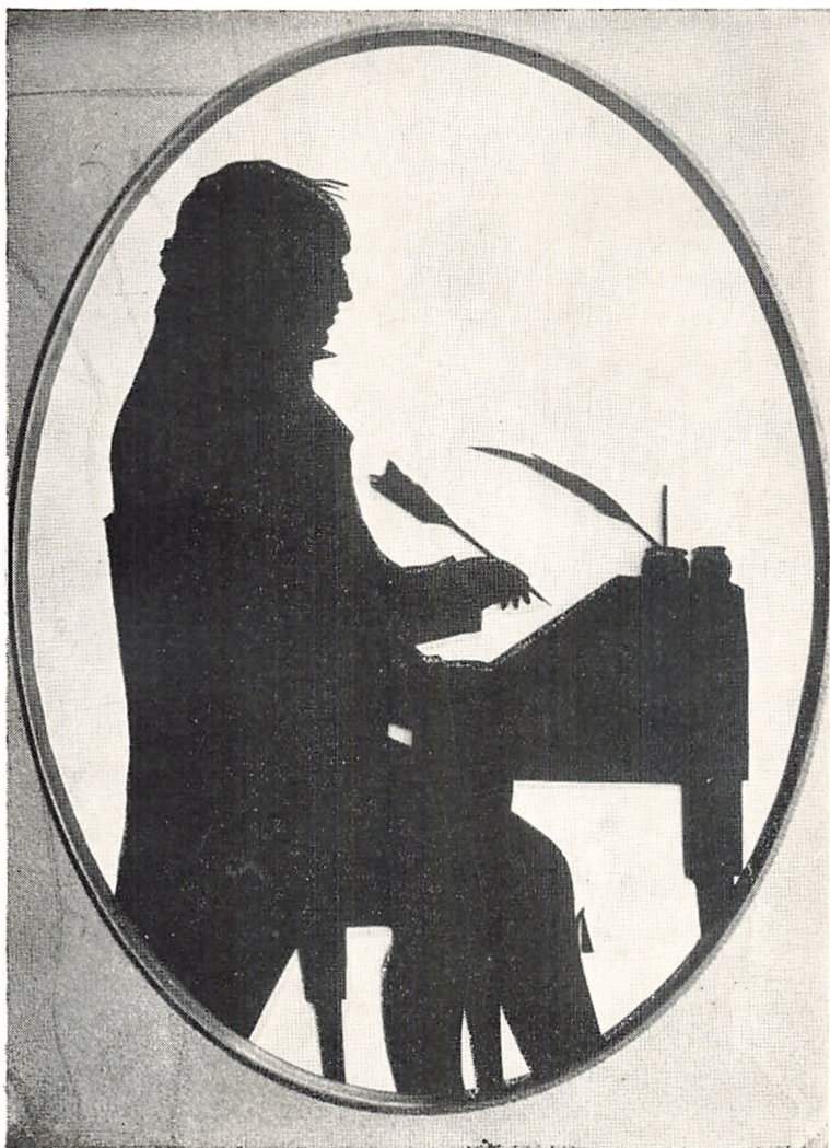
Niels Mygind Krogh. 1778 – 1859. Side 105.