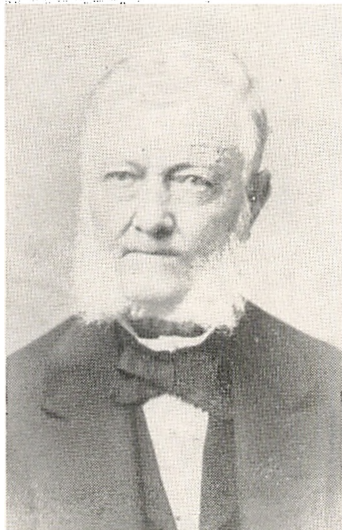
Etatsraad Hans Detlef Krogh ca. 75 Aar. 1803—1878. Side 52.