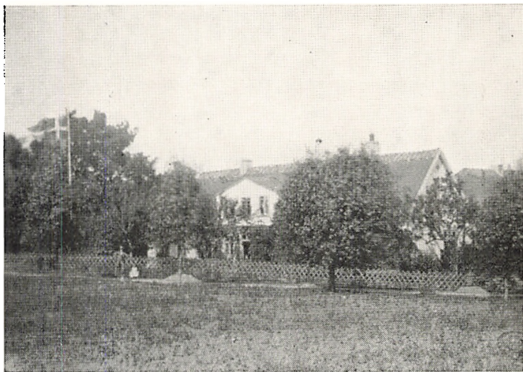
Vogstrupgaard i Nordsjælland.