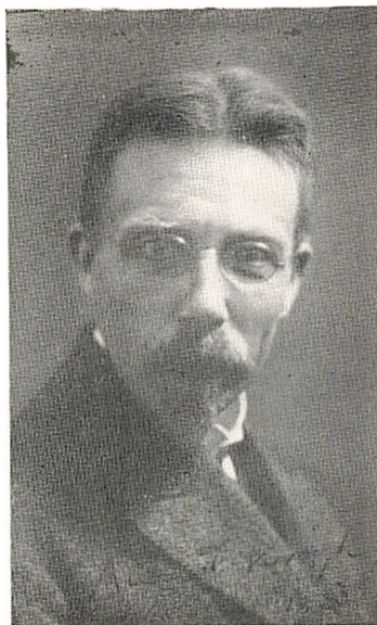
Prof., Dr. phil. August Krogh. f. 1874. Side 159.