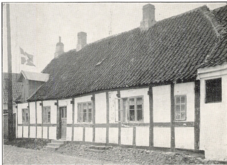
Bryggergaarden i Grenaa, mod Nederstræde.