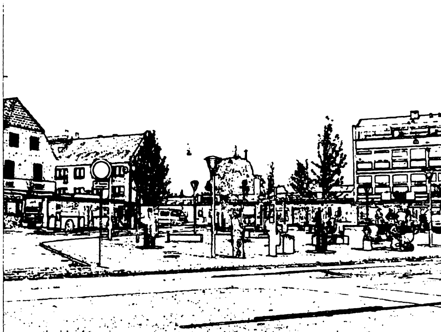
HUSUM TORV 2002 – ET NYT STYKKE LOKALHISTORIE

Kilder: Klip fra Nyt fra Lokalhistorien artikler, nr.9, nr.8, nr.13, nr.32. Brønshøj avis 1926, 1936 og forskellige indsamlede noter bl.a. af A. Karoli Hansen, R. Tolver Christensen. Filmhusets Bibliotek. / Svend Olsen 2001