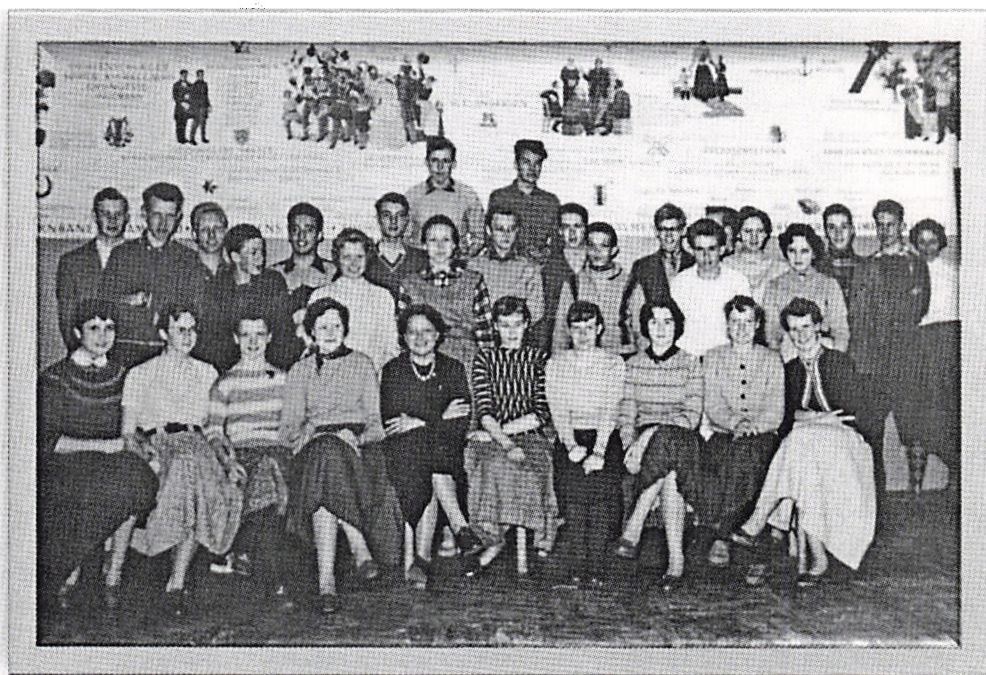
Realklassen 1957 i Bellahøj Skole. Forfatteren er nr. 3 fra venstre i forreste række.