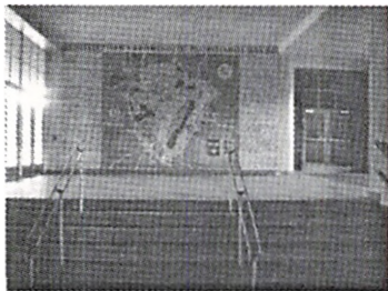
fra Bellahøj Skole