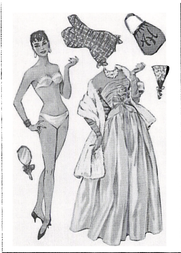
Audrey Hepburn som påklædningsdukke