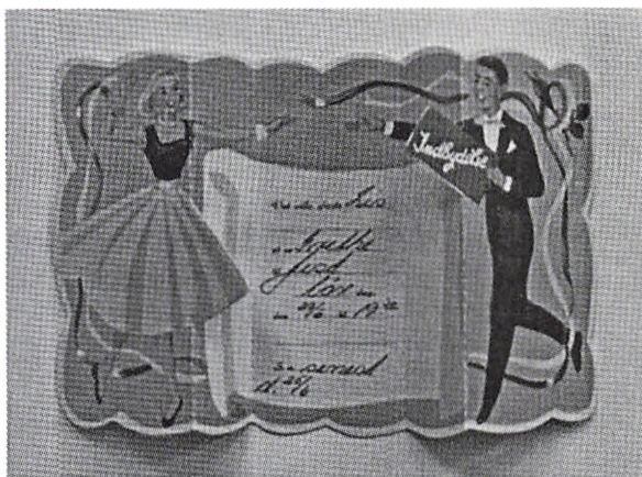
“Det ville glæde Lis at se Grethe til fest... ...”

I gården bagved Bella Bio lå Brønshøj Bibliotek, og det blev også flittigt besøgt. Dengang havde vi ikke hverken fjernsyn eller computere til at underholde os med, og der blev slugt mange bøger - også Ota Solgryns små historiske fortællinger i populæruddgave.