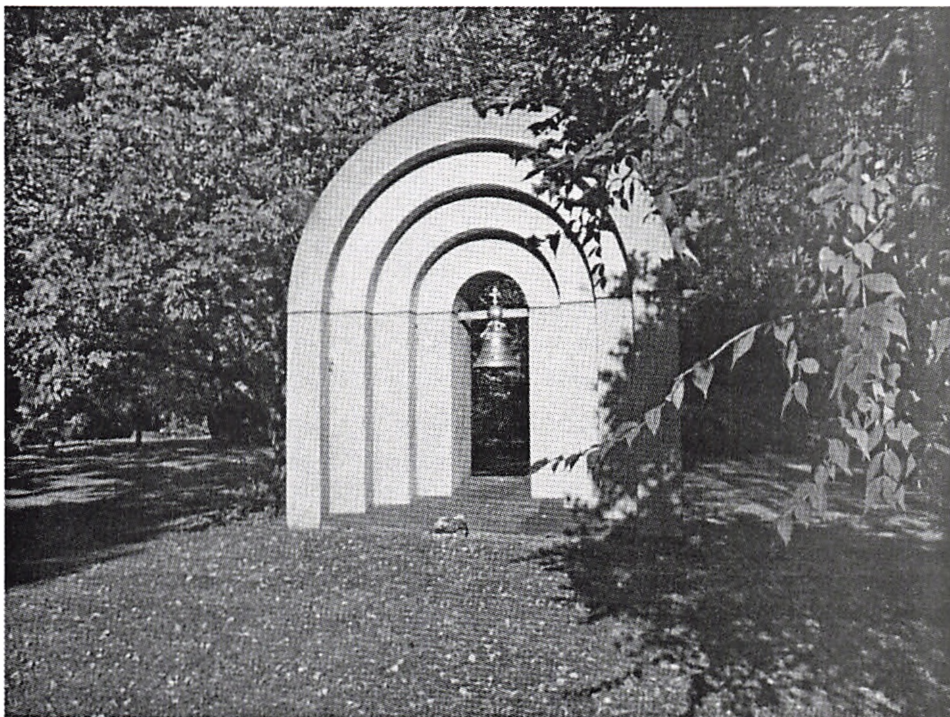
Symbolisk klokkemonument ved de russiske grave på Bispebjerg Kirkegård

Alle oplysninger, man måtte ligge inde med om de gravlagte russere, har min interesse. Jeg møder gerne op til en samtale om emnet, hvis det har interesse.