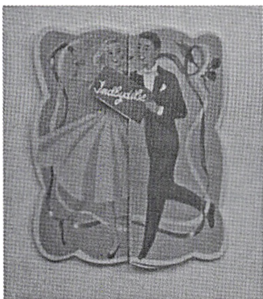
Indbydelse! Til hvad mon?