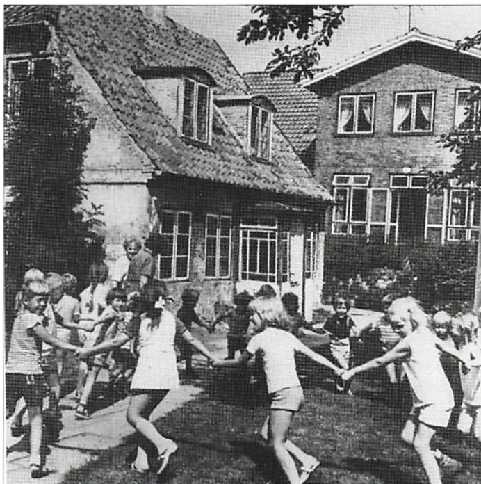
I baggrunden ses den nuv. Husum Asylbygning og forgrunden tv.en del af det oprindelige Lindlyhus, som blev nedrevet i 1971

Kilder: Asger Fog: Husum, - landsbyen der forsvandt, og Lars Cramer-Petersen: Frederikssundsvej – Fra Brønshøj Torv til Kagsbro. Begge fra Brønshøj Museum.