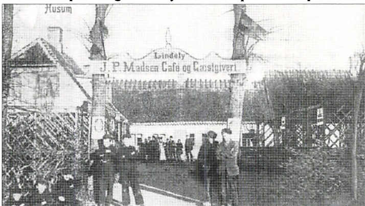
Postkort fra omkring 1900, derfor den dårlige kvalitet af billedet, som viser Lindly som velbesøgt krohave