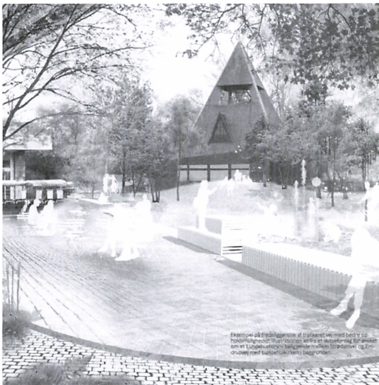
Det nye byrum udfærdiget af Tegnestuen Sted. Fra Bydelsplan for Bispebjerg 2017-2020