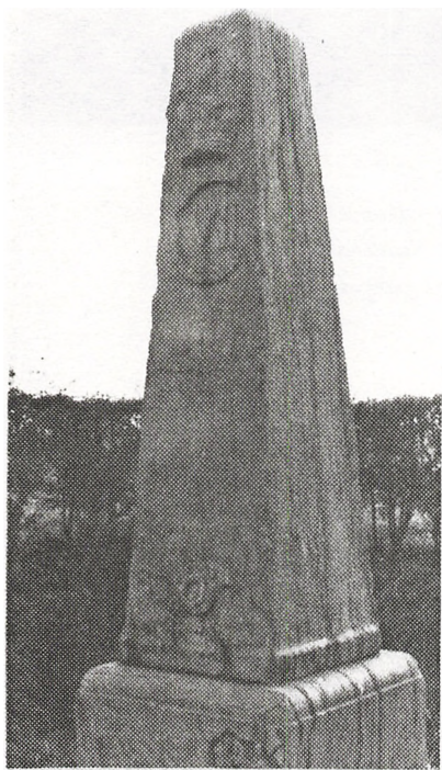
Christian d. VII - 5 1/2 Mil. Granitsten på en sokkel af norsk marmor. Eneste bevar- ede halvmilesten af de oprindelige i Fr.borg amt.