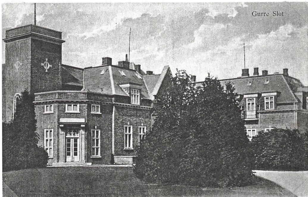
Gurrehus, som tidligere også blev kaldt Gurre Slot