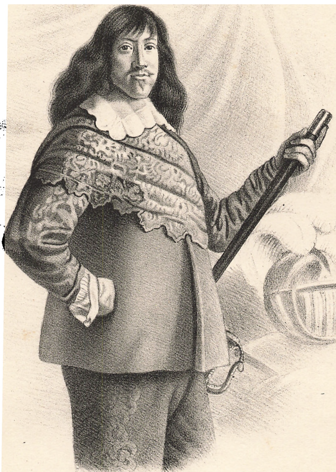
Nm. Færestuens * lith. 1861