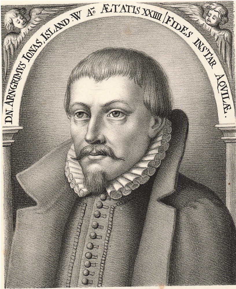
En Børnsten & C. H. Inst.