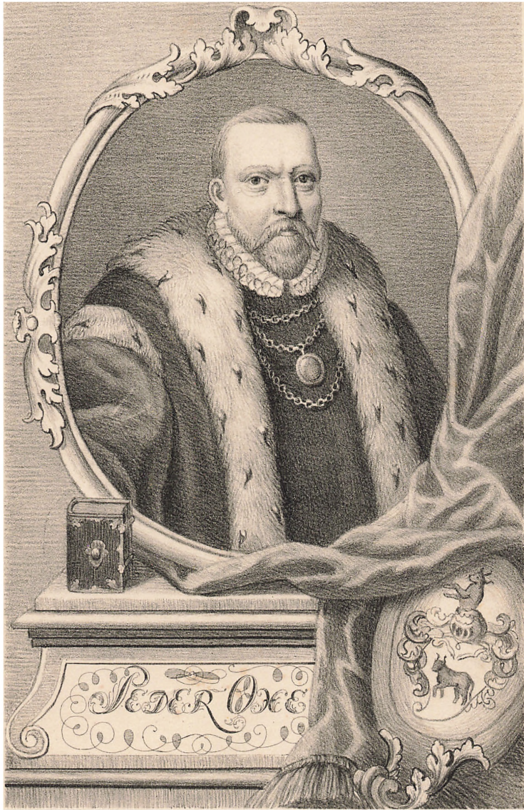
Portraitet efter et Måleri paa Rosenberg.