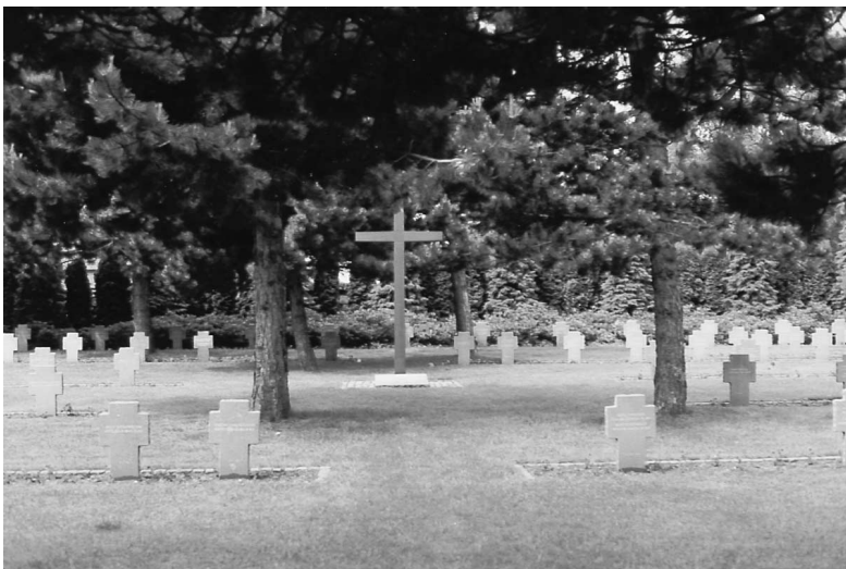
Den tyske afdeling på Viborg Kirkegård. De ca. 200 gravsteder vedligeholdes af Viborg Kirkegård samt »Volksbund Deutsche Kriegsgräberfürsorge«. (Gravstederne uden kors indeholder muligvis henrettede soldater).