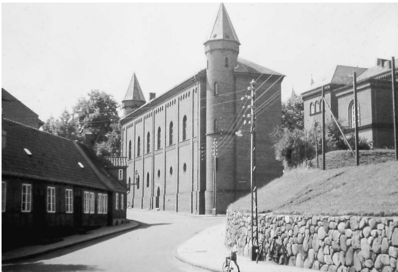
Viborg Arrest set fra Sct. Nicolai Gade med Rådhuset yderst til højre (foto, forfatteren 1959).

fronten i krigens sidste dage, blot rangeret ind på nogle sidespor, hvor tyskerne gav dem betegnelsen »Kriegslazarett Viborg, Teillazarett Bahnhof«.