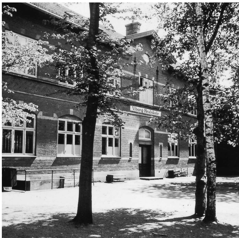
Føns' Skole 1943.

kunder havde købt en vare, at spørge, om de ville have den med eller ønskede den bragt.