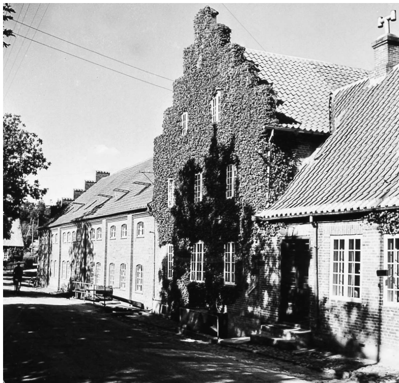
Sønder Mølle 1939.

Jeg blev budt indenfor, så vi kunne tale om det, for de havde godt nok talt om, at de ville have ansat en dreng mere. Da vi havde talt sammen en kort tid, sagde han, at de havde også nogle kartofler, der skulle tages op, og om jeg kunne hjælpe med det, hvortil jeg svarede, at det kunne jeg godt, for det havde jeg prøvet før. Jeg havde på fornemmelsen, at sagde jeg nej til at hjælpe med kartoffeloptagningen, så fik jeg nok ikke arbejdet som spinderdreng. Godt, sagde han, så kan du begynde på mandag; men da jeg var på vej ud ad døren, sagde han pludselig: Nej, vent lidt, du skal ikke begynde før på tirsdag, man skal aldrig begynde på noget nyt en mandag. Han var nemlig overtroisk.