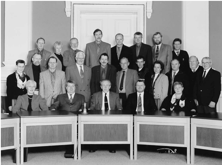
Byrådet fra 1985.

vi ville, og ikke bruge kræfter på at fortælle, hvad vi mente de andre partier havde gjort for dårligt.