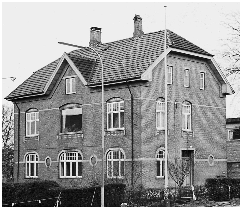
Vesterbrogade 13, opført kort efter år 1900 af sagfører Carl Handberg, senere restaurant Rio Grande, nu medborgerhus.

provokerende i den måde, de gik klædt. De var langhårede og gik i sommerhalvåret med bare fødder på gaden, hvilket gav anledning til, at de også blev kaldt for barfodsfolket.