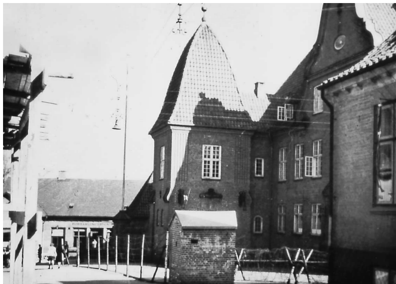
Generalkommandoen under den tyske besættelse, omgivet af »spanske ryttere« og pigtrådsspærringer. Blokhuset med skydeskår var til vagtposten (foto, Carl Johan Zacho, der boede umiddelbart skråt overfor, 1944-45).

med en hilsen til mig. Jeg vil herved gerne formidle min hjerteligste tak.