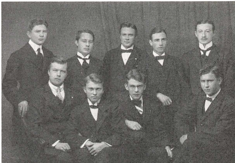
Deltagerne i Sønderjyllandsturen.