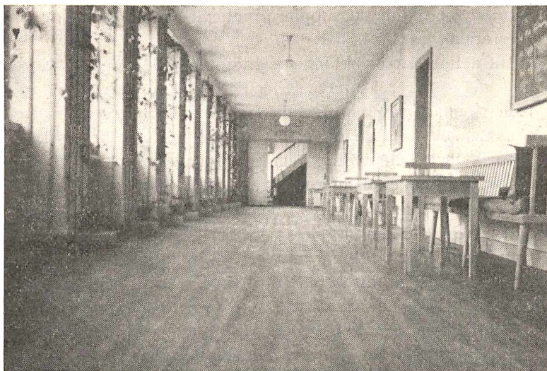
Vandrehallen på det gamle Jonstrup.

hovedindgangen og ud gennem branddøren til kollegieafdelingen efter konsultationen hos »pædagogen«, der var udstyret med stetoskop, båndoptager og megafon. Denne megafon spillede den vigtigste rolle, idet mundstykket var sværtet med kønrøg, som forårsagede megen moro blandt tilskuerne ved udgangsdøren, til »ofrets« store forundring. Vore glæder var få og simple, men aldrig ondsksfulde.