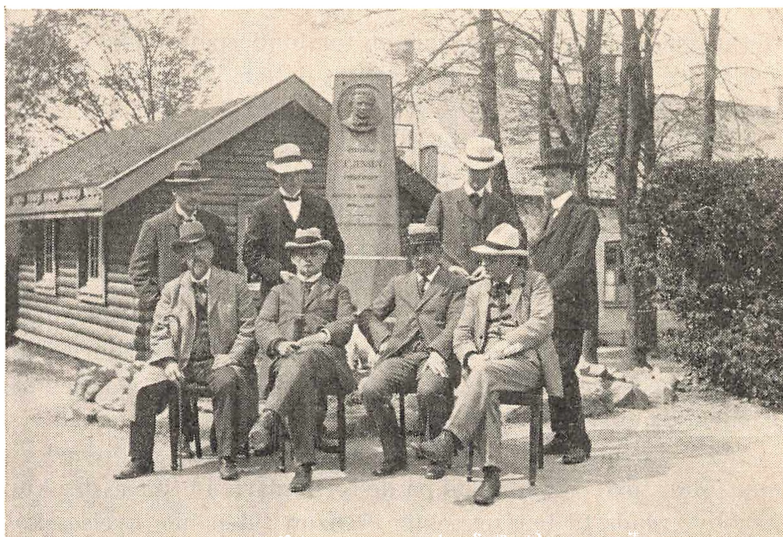
Seminariets lærerstab 1918.