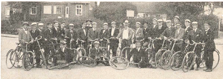
Cykleturen med Fatter.

Den sidste sommer fik vi da også, traditionen tro, vor cykleudflugt sammen med Fatter. Vi kørte over Farum til Birkerød, hvor vi besøgte kirken, og derfra over Hørsholm ud til Rungsted kyst, hvor Fatter gav kaffe og cigarer på kroen, og så gik turen ad Strandvejen til Klampenborg og derfra over Lyngby hjem til borgeren, en helt god præstation i hans alder.