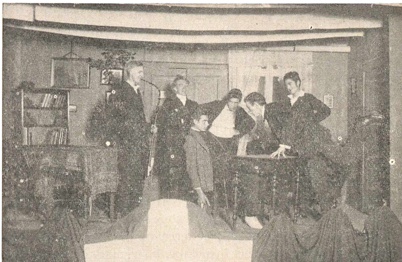
Scene fra »Jonstruppere«.