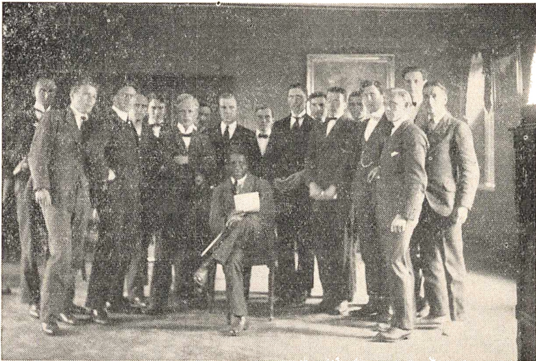
Jonstrupperklassen 1916—1919 til korøvelse. (Dirigent: Cornelins).